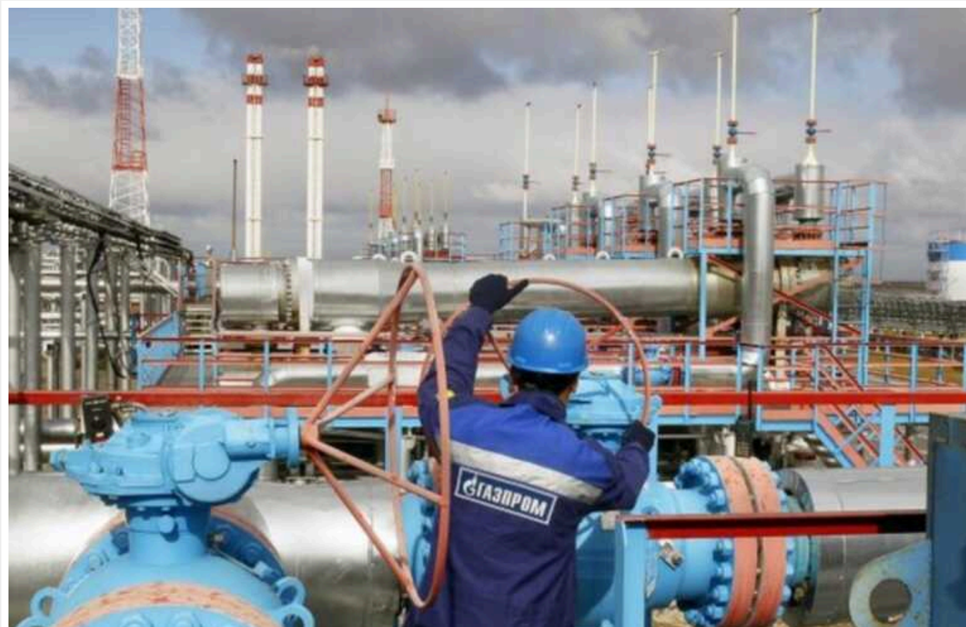
Bloomberg: Європа позбавляється газової залежності від РФ

Європейські країни не відчувли підвищення цін на газ, попри проблеми з перевезеннями на Близькому Сході. Це свідчить про те, що Європа змогла адаптуватися до життя без російського газу.