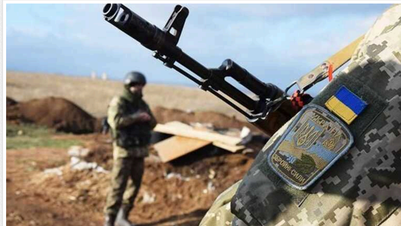
Середній вік солдатів ЗСУ на фронті – 43 роки, "чи зможуть вони стримати Путіна", – The Sunday Times

Видання The Sunday Times пише, що ті, хто пішов воювати добровільно на початку війни, вже "морально і фізично виснажені, і на заміну їм не вистачає молодших бійців".