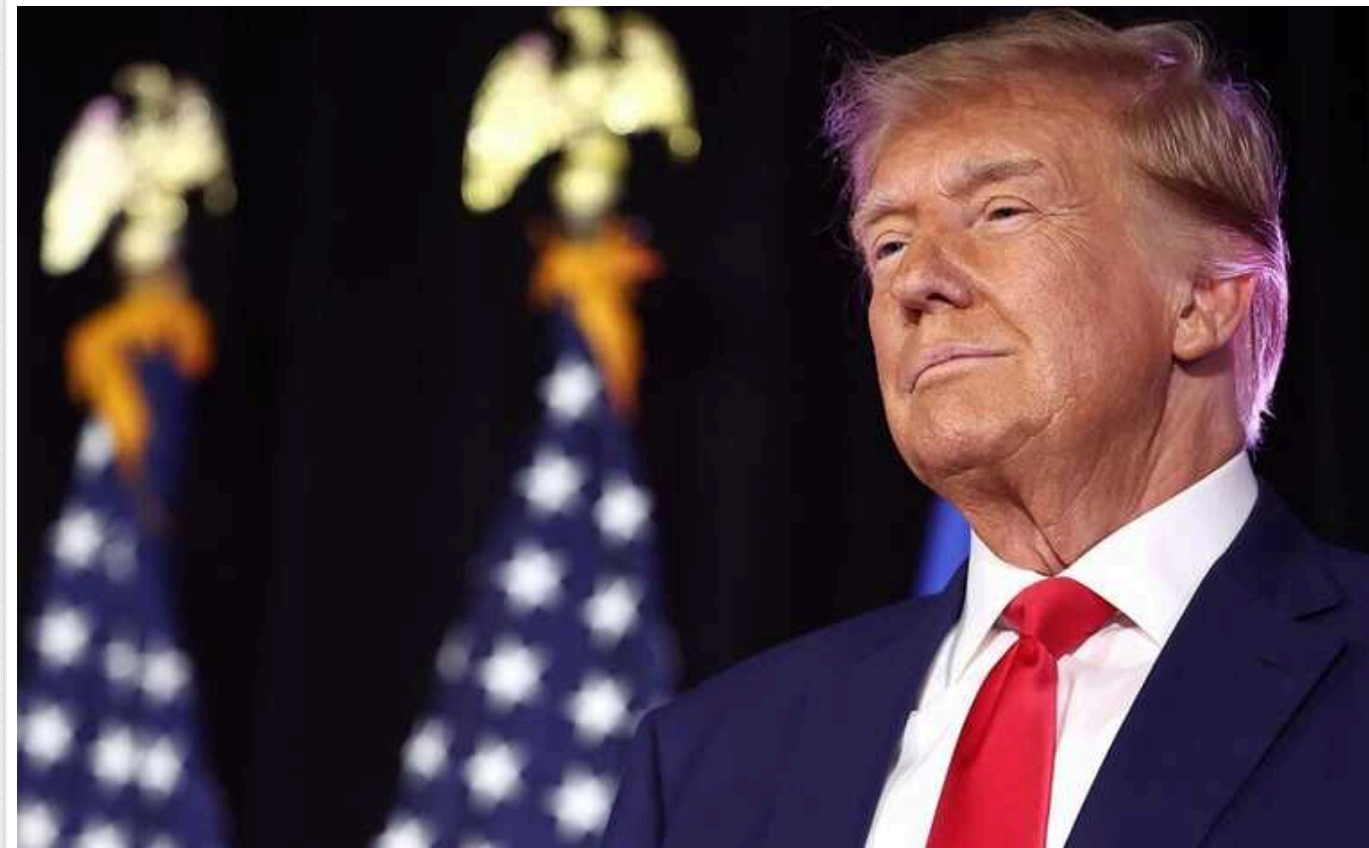
Трамп заявив, що у разі перемоги ще до інавгурації закінчить війну в Україні

Трамп заявив, що у разі перемоги на виборах президента зупинить війну в Україні ще до інавгурації.