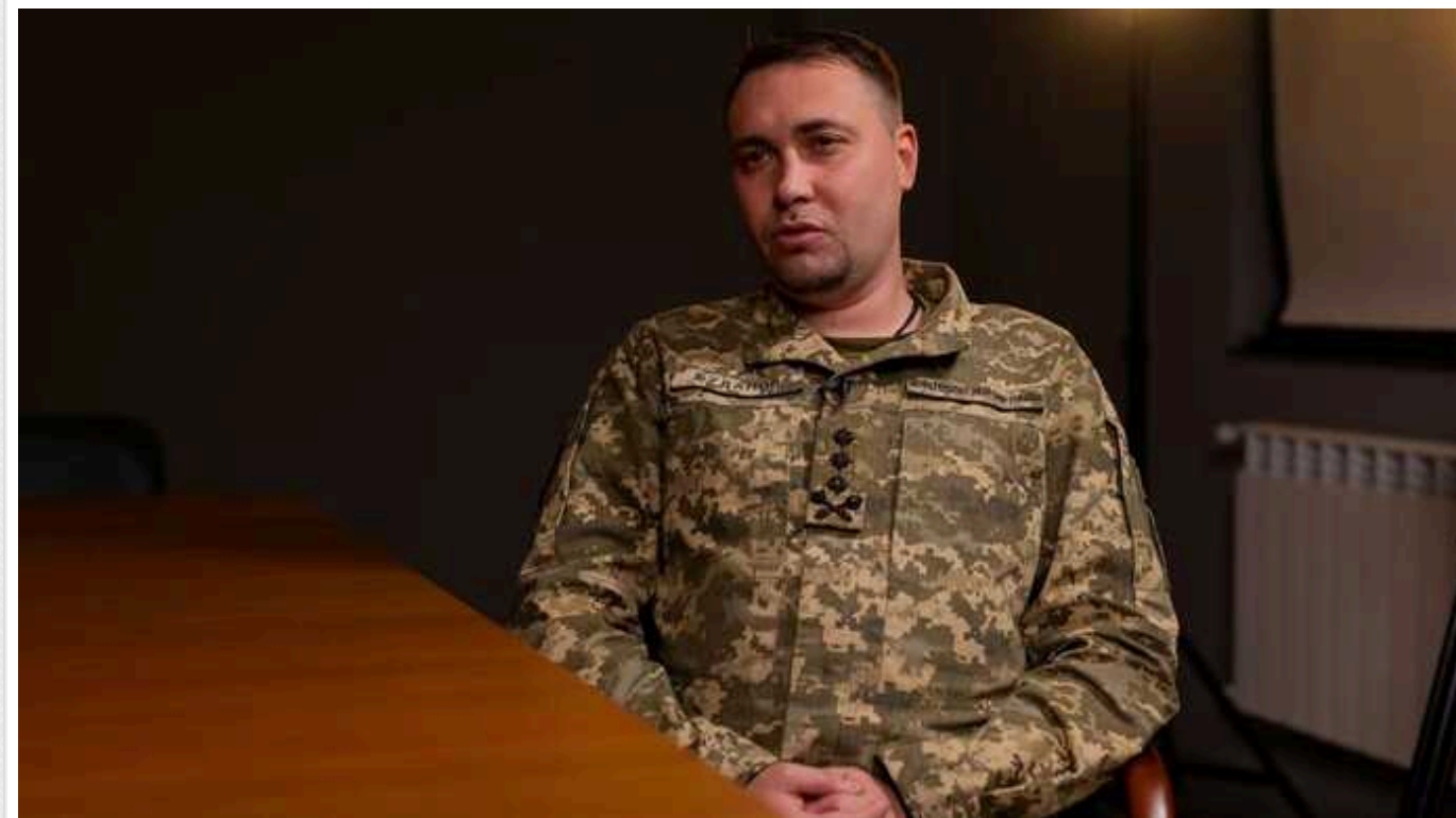
Буданов про війну в Україні у 2024 році: Сподіваюся наші успіхи будуть більшими, ніж у Росії

Начальник ГУР Кирило Буданов відмовився давати "сміливі прогнози" на 2024 рік.