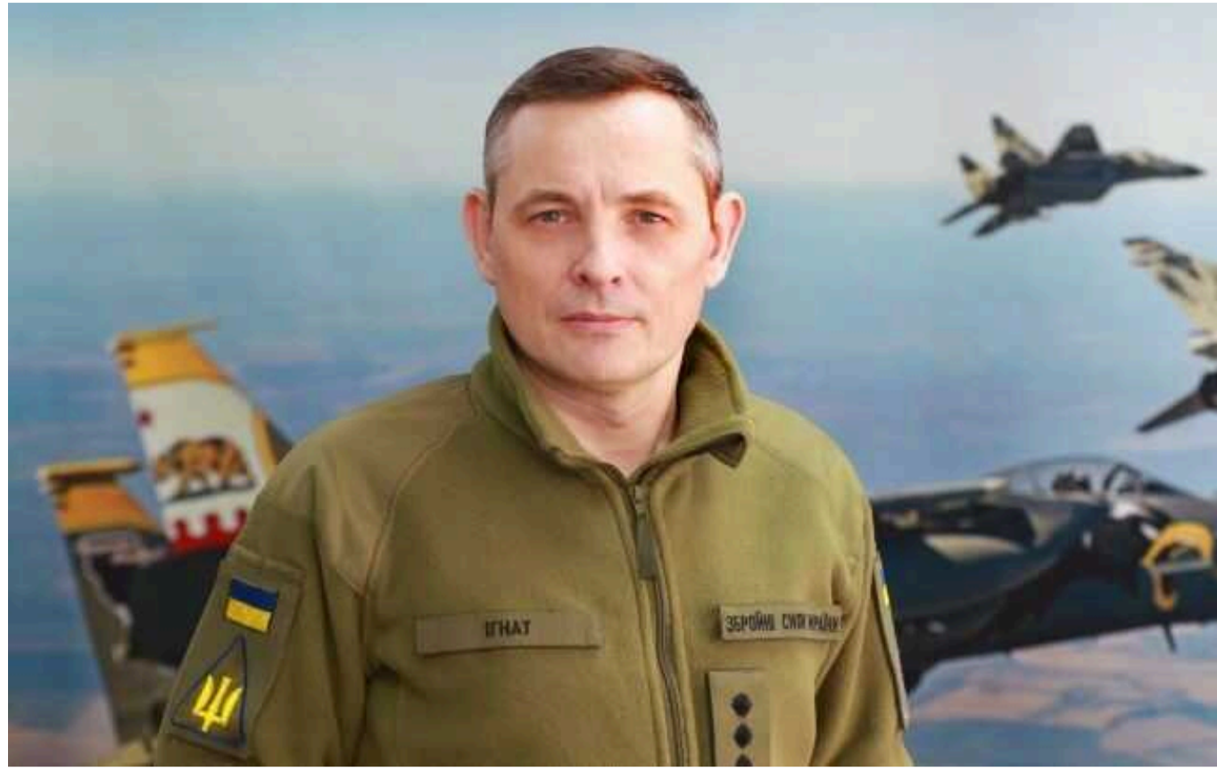
У ЗСУ пояснили, як винищувачі F-16 зможуть змінити перебіг війни

Він зазначив, що перевага у повітрі на лінії бойового зіткнення на підконтрольній Україні та окупованій території – це ключ до успіху операцій.