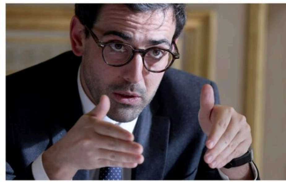
L'Ukraine, face à l'Europe, le ministre des affaires étrangères, au début de son mandat. Stéphane Séjourné nous explique le rôle d'Europe pour l'avenir dans ses entretiens à l'Europe

Теги: Франція Франція Сежурне Стефан МИД Франції Напад Росії на Україну Война Війна Україна