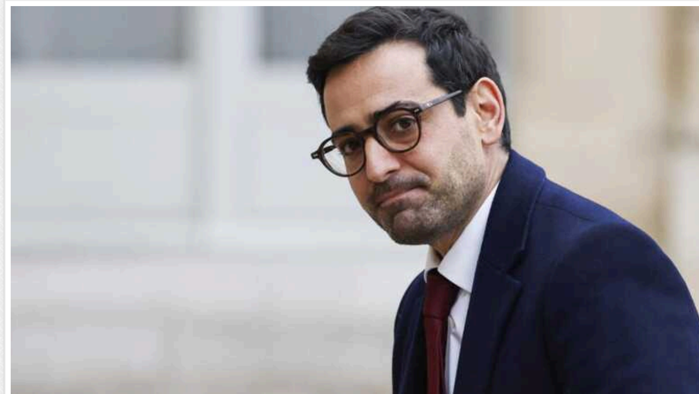
Глава МЗС Франції Сежурне: РФ контролюватиме 30% експорту зерна у світі, якщо Україна програє

На цьому наголосив міністр закордонних справ Франції Стефан Сежурне в інтерв'ю Le Parisien.