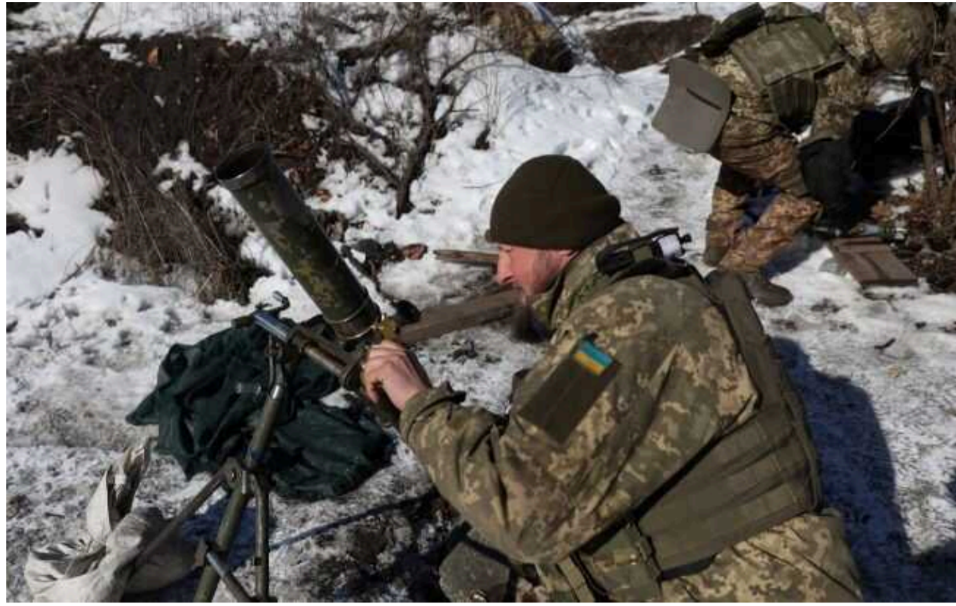
В ISW повідомили про захоплення Крохмального: у ЗСУ пояснили ситуацію

Захоплення окупантами Крохмального у Куп'янському районі Харківської області – тимчасове явище. Для РФ подібна ситуація дозволяє виправдати втрату понад 7 тисяч військових із початку року.