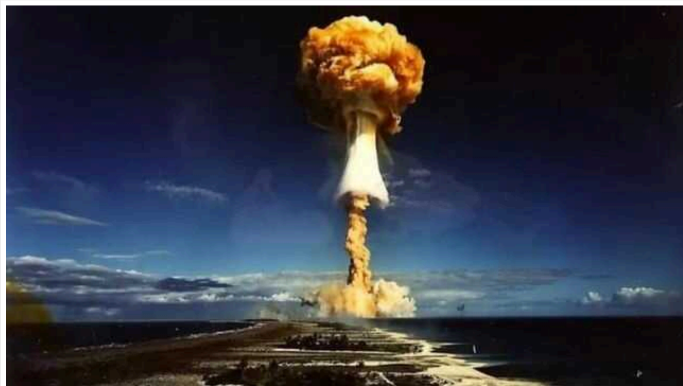
Bloomberg: Зростає ризик ядерної війни між КНДР і США

Ризик ядерної війни між Північною Кореєю та США зростає. Останнім часом з'являється все більше ознак того, що диктатор Північної Кореї, який накопичив арсенал ядерної зброї та ракет, може прорахуватися і застосувати їх.