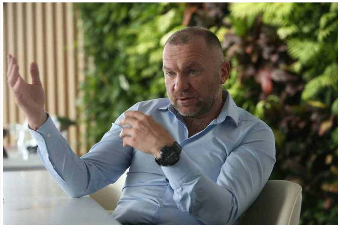
Справа Мазепи: повідомлено про підозру 12 особам

Прокуратура повідомила про підозру 12 особам, які можуть бути причетними до розкрадання стратегічних земель Київської ГЕС.