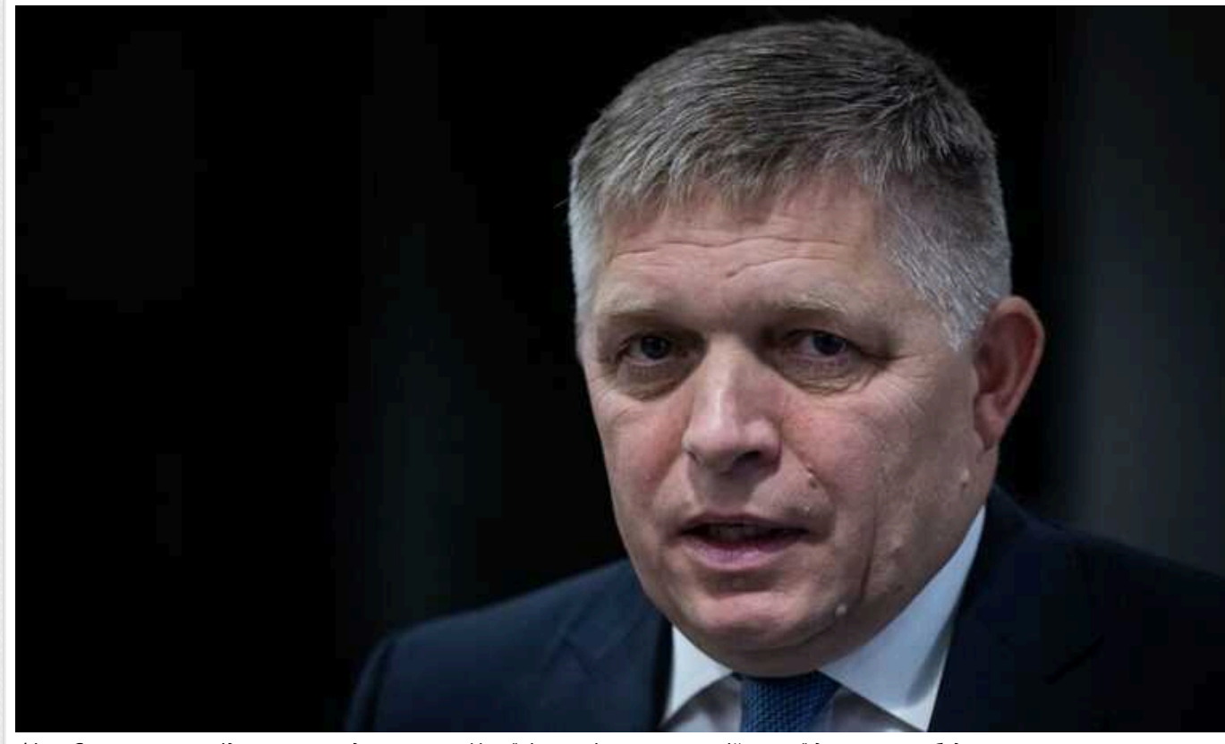
Фіцо: Словаччина не відмовляється допомагати Україні гуманітарною, але військової допомоги не буде

Прем'єр-міністр Словаччини Роберт Фіцо зустрінеться з українським колегою Денисом Шмигалем в українському Ужгороді уже в найближчу середу, 24 січня. Політик має намір підтвердити, що його країна не допомагатиме Україні у військовому плані, але надасть гуманітарну допомогу.