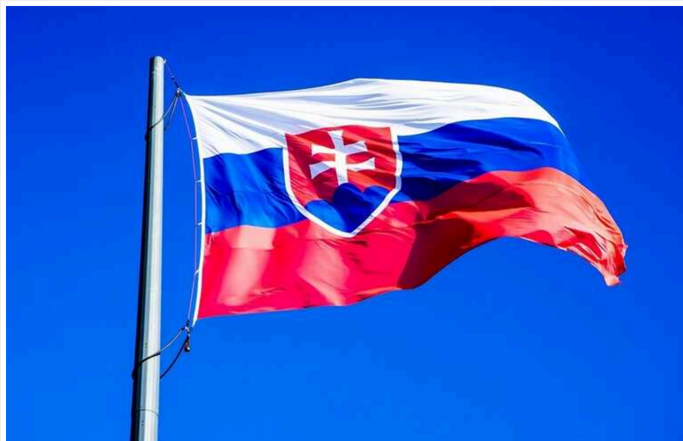
Словаччина скасувала заборону на культурну співпрацю з Росією та Білоруссю

Словаччина скасувала заборону на культурне співробітництво з Росією та Білоруссю, введений після початку повномасштабної війни Росії проти України.