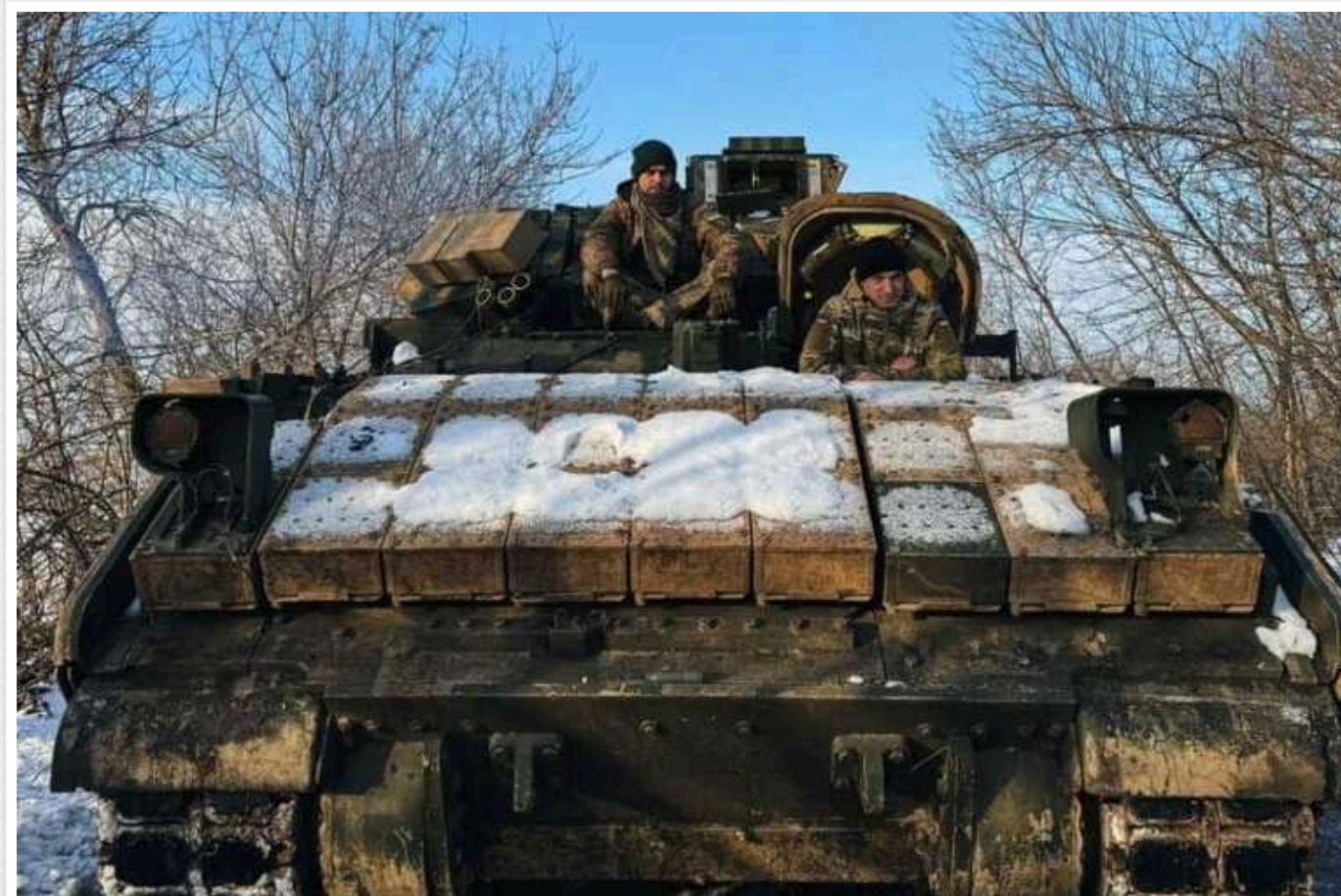
47 омбр показала екіпаж Bradley, який епічно знищив російський танк Т-90 "Прорив"

47-ма окрема механізована бригада ЗСУ показала екіпаж американської БМП M2 Bradley, який днями знищив сучасний російський танк Т-90 "Прорив".