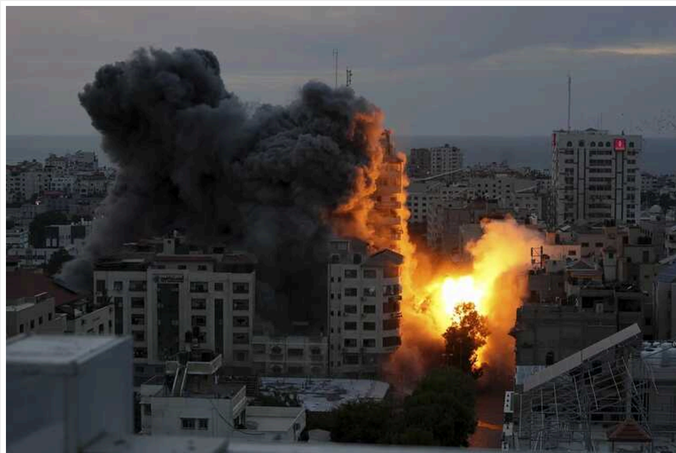
Євросоюз розробив мирний план для вирішення ізраїльсько-палестинського конфлікту, - ЗМІ

Європейський Союз розробив план із 10 пунктів для надійного, всеосяжного вирішення ізраїльсько-палестинського конфлікту.