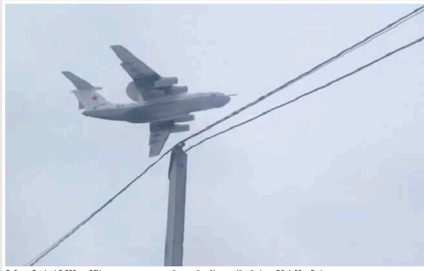
Робота Patriot і С-300: як ЗСУ заманили в пастку найкращий радіолокаційний літак РФ А-50, – Forbes

Повітряні сили України ввечері 14 січня 2024 року знищили російський літак дальнього радіолокаційного виявлення А-50 та значно пошкодили повітряний командний пункт Іл-22М над акваторією Азовського моря. Літак А-50 – один із дуже рідкісних і дуже цінних літаків раннього попередження з радіолокатором російських ВПС. Внаслідок збиття, імовірно, загинули всі 15 осіб на борту, зокрема й високопоставлені офіцери.