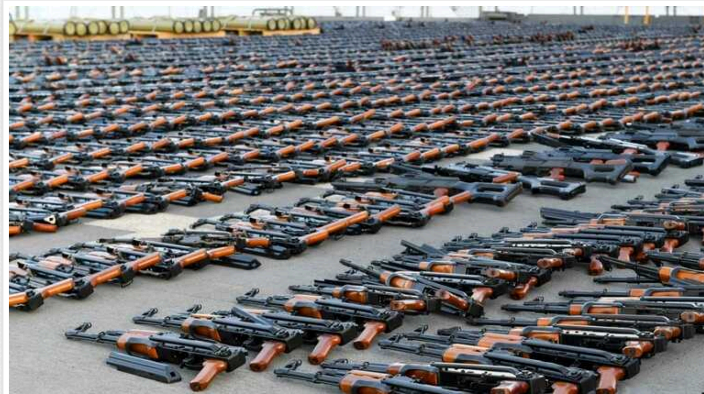
США та Україна провели першу спільну інспекцію переданої американської зброї

Україна провела першу спільну зі США інспекцію зброї, наданої американськими партнерами.