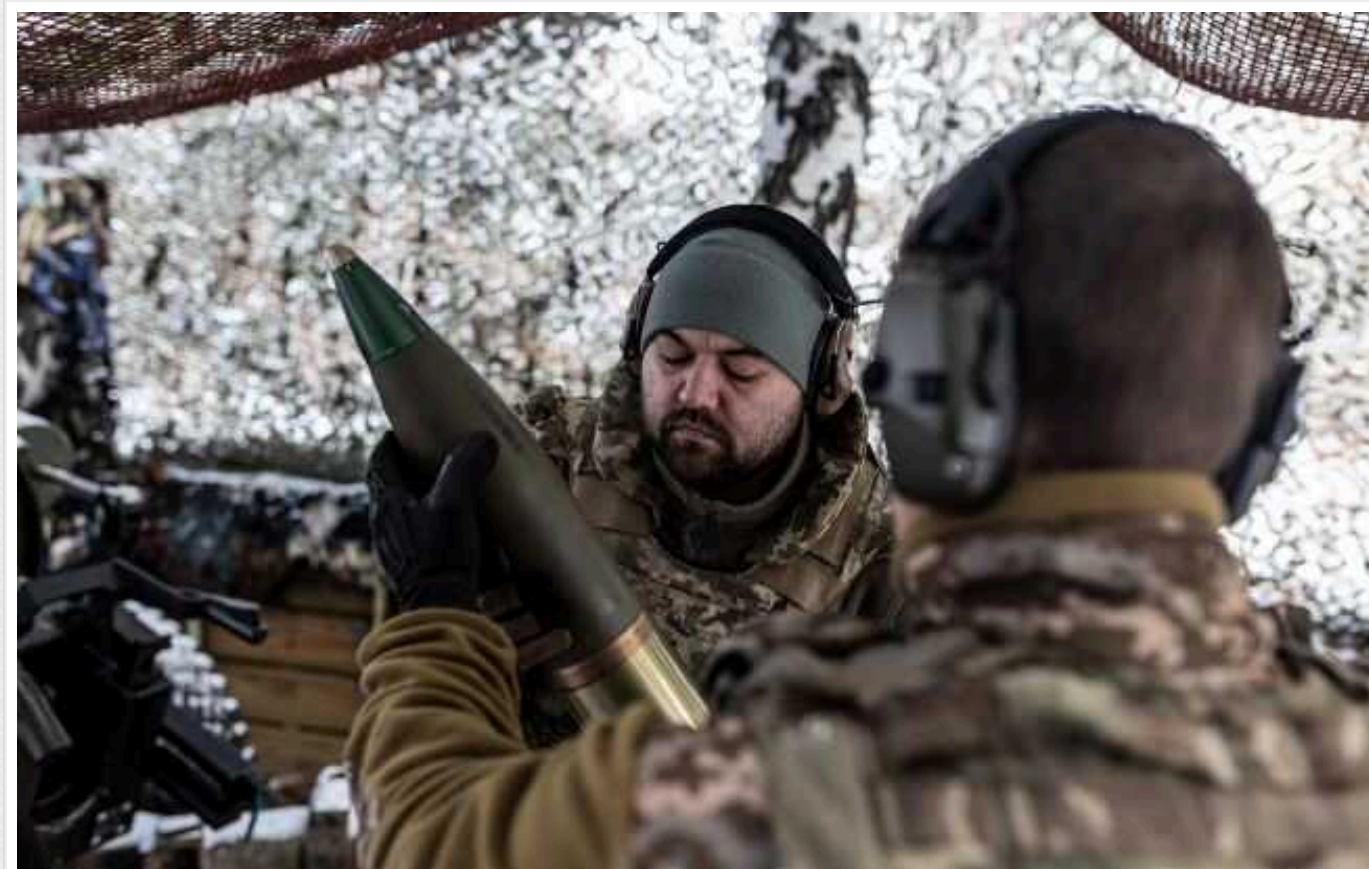
Загарбники активно використовують артилерію та велику кількість піхоти в Авдіївці та Мар'їнці, – Сили оборони

Російська терористична армія продовжує здійснювати штурмові дії на Авдіївському та Мар'їнському напрямках. Причому путінські війська в основному використовують артилерійські засоби та величезну кількість піхоти.