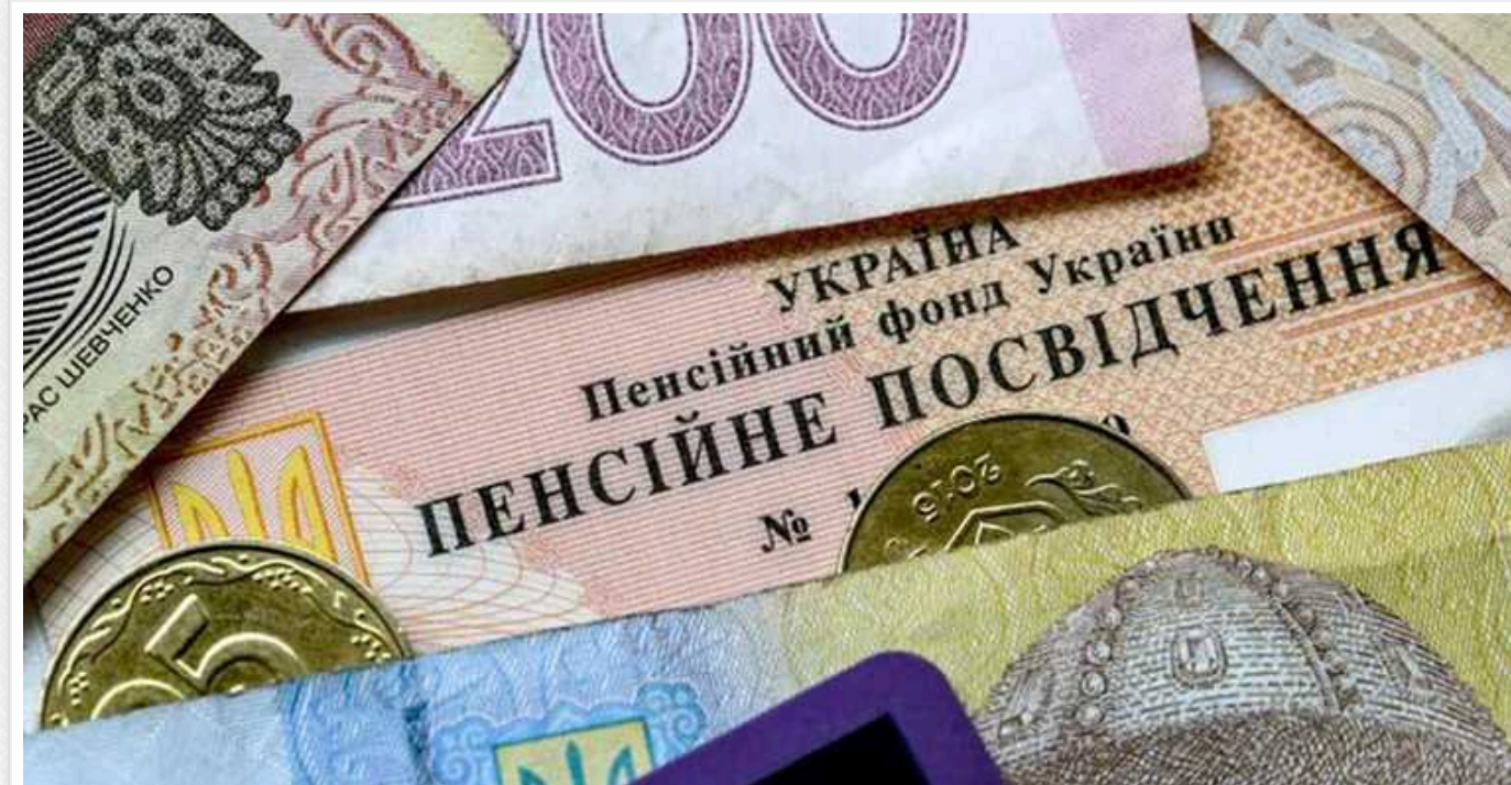
В Україні маніпулюють розміром пенсії: абсолютна більшість отримує значно менше за середню

В Україні розмір середньої пенсії – маніпулятивний. Насправді він не показує, які виплати одержує більшість українців.