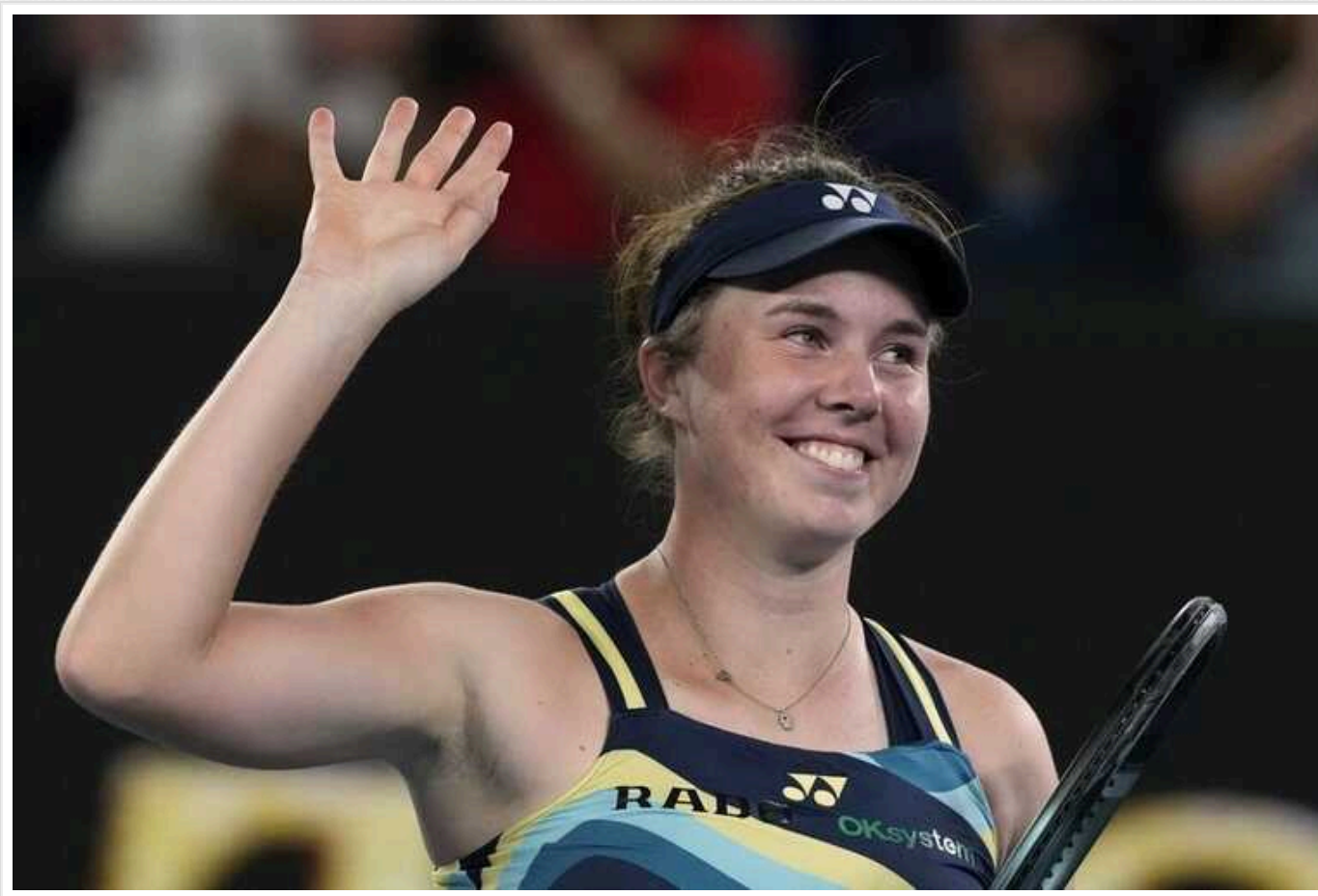
На Australian Open сталася грандіозна сенсація: перша ракетка світу Іга Шв'юнтек сенсаційно програла чешці Лінді Носковій

Перша ракетка світу Іга Шв'юнтек сенсаційно програла чешці Лінді Носковій (№50 WTA) на Australian Open, який з 14 по 28 січня проходить у Мельбурні. Поєдинок польської тенісистки, яка була посіяна на турнірі під першим номером, менш ніж за годину завершився поразкою у трьох сетах – 6:3, 3:6, 4:6.