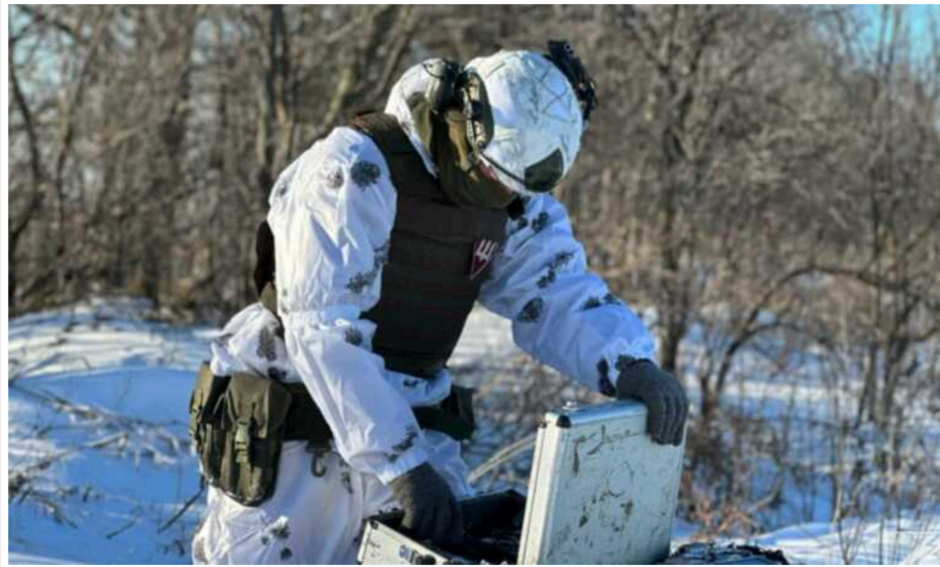
Українські десантники захопили ворожу позицію, ліквідувавши пів взводу загарбників

Бійці 25-ої окремої десантно-штурмової Січеславської бригади Збройних сил України за п'ять хвилин захопили позицію російських окупантів, знищивши десяток загарбників (пів взводу) і примусивши ще стільки ж втекти.