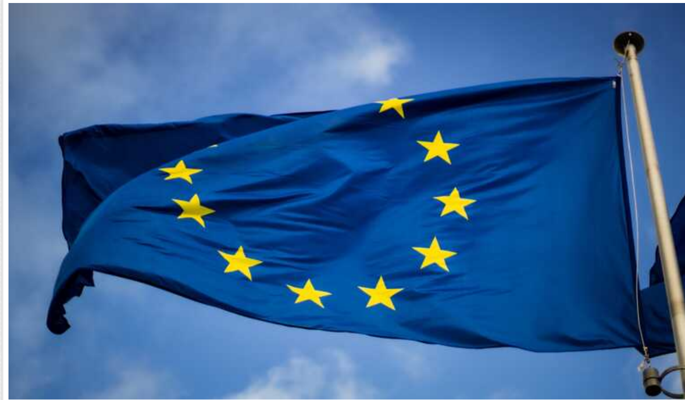
Євросоюз хоче реформувати фонд військової допомоги Україні на 5 мільярдів євро, - ЗМІ

Зовнішньополітичне відомство Євросоюзу представило державам-членам пропозицію щодо реформування фонду, який надає військову підтримку Україні, оскільки ЄС переходить від надання зброї з наявних запасів до закупівлі нової.