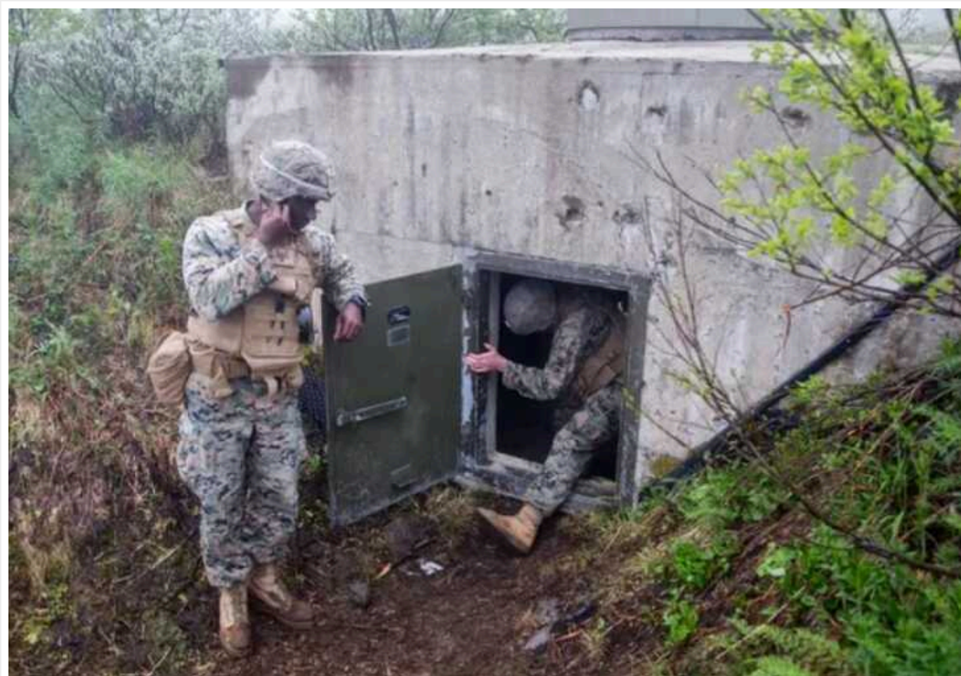
Естонія вирішила відгородитися від РФ лінією оборони з 600 бункерів

Естонія планує спорудити лінію оборони на російському кордоні, що складатиметься з 600 бетонних бункерів, для відбиття можливої російської агресії. Більшість цих бункерів буде розташована на північному та південному сході країни, а також у центральній зоні неподалік від Чудського озера.