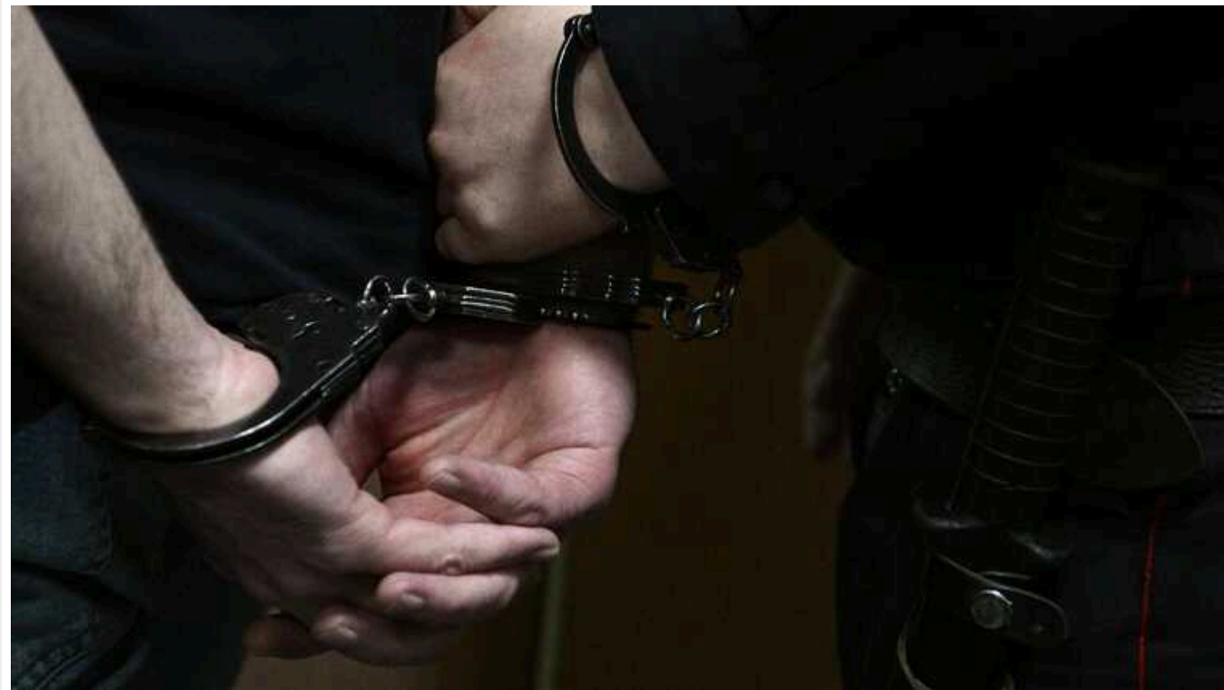
У Харківській області чоловік убив товариша та скинув його тіло на залізничну колію

За процесуального керівництва Державіської окружної прокуратури Харківської області повідомлено про підозру 70-річному чоловіку за фактом умисного вбивства (ч. 1 ст. 115 КК України).