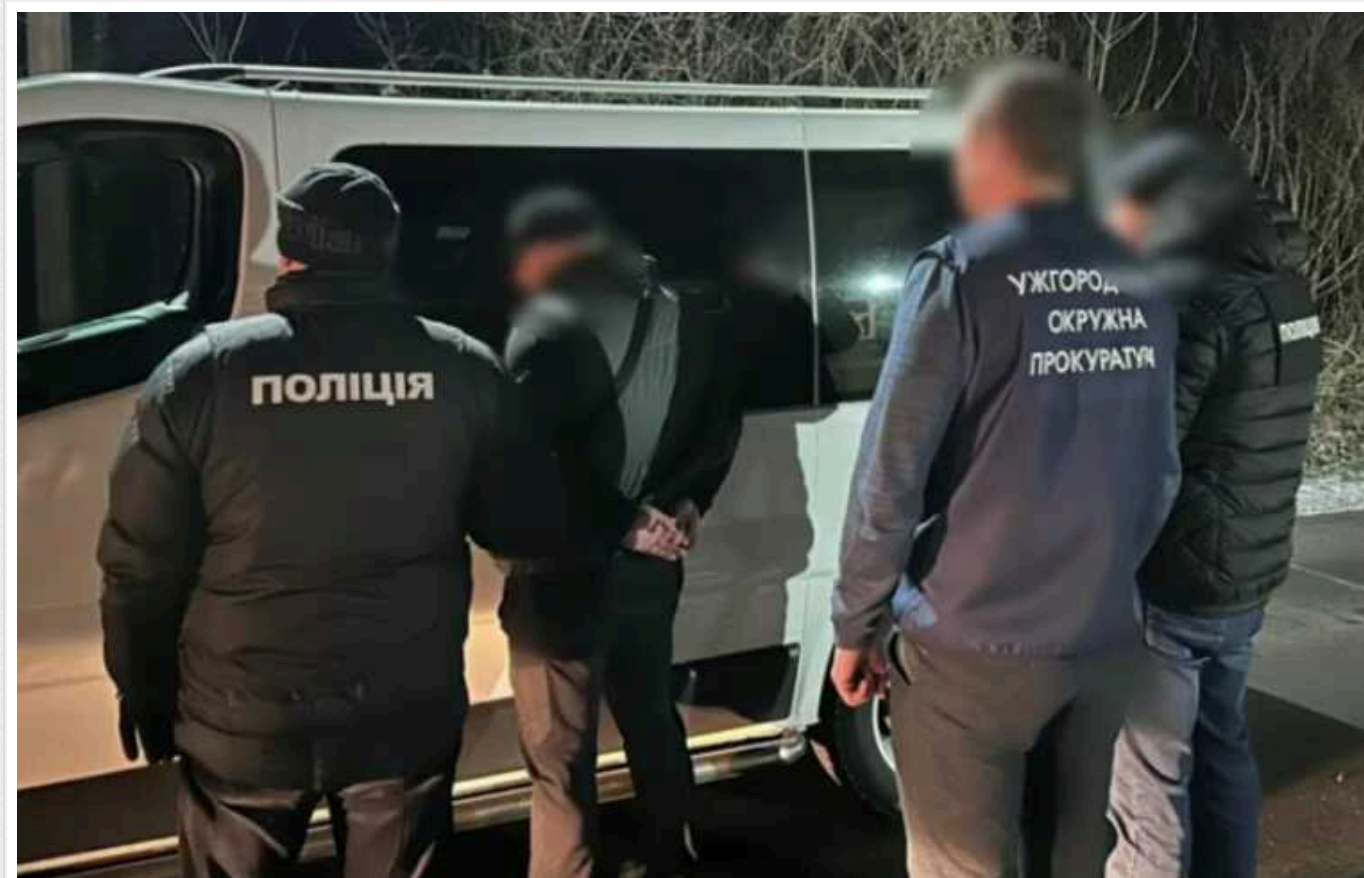
Поліція Закарпаття заблокувала ще один канал переправлення ухлянтів до Європи

Закарпатські поліцейські заблокували нелегальний канал перетину чоловіками призовного віку кордону.