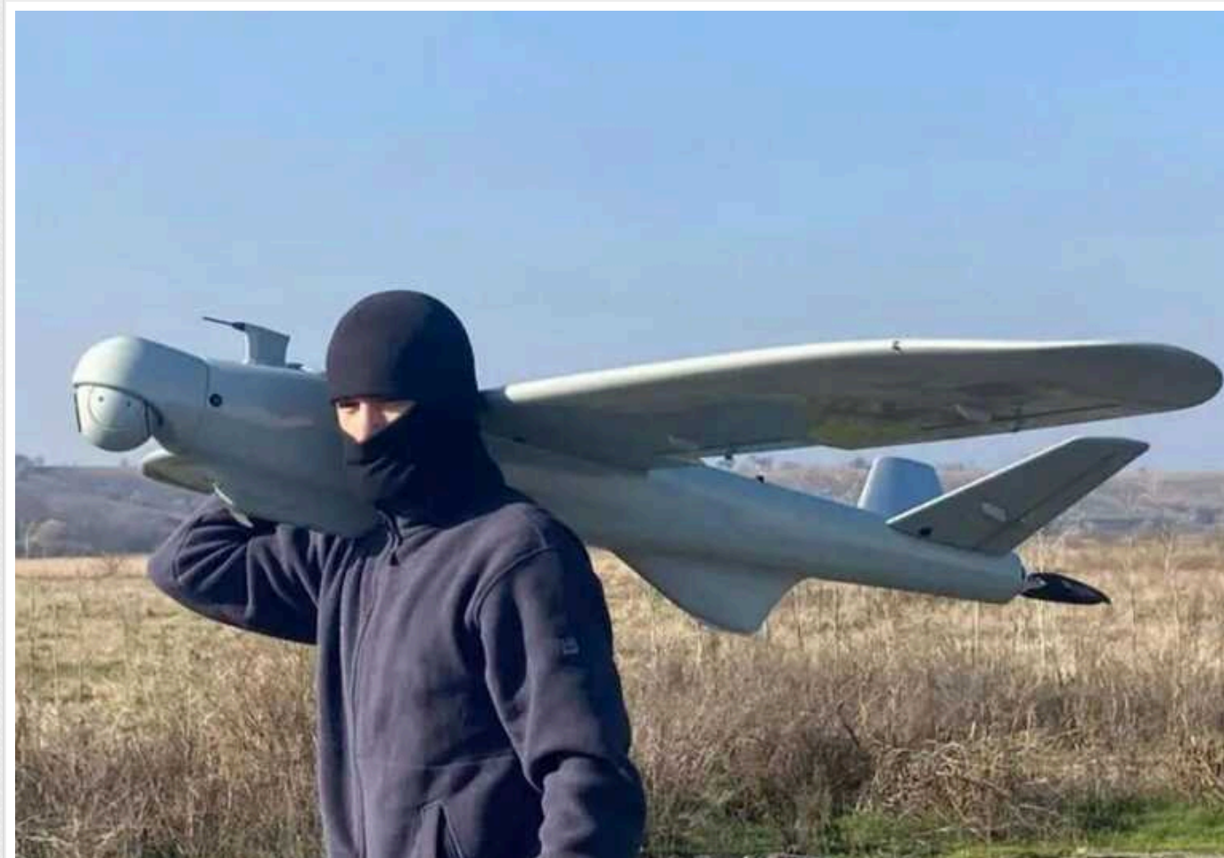
В Україні представили найновіший безпілотний авіаційний розвідувальний комплекс Leleka LR

Украино-чеськая компания UAC представила новейший беспилотный авиационный разведывательный комплекс Leleka LR. Это украинский дрон, производимый за пределами Украины на чешском заводе компании Devigo. Диверсификация производства направлена на обеспечение материально-технической и интеллектуальной базы производства.