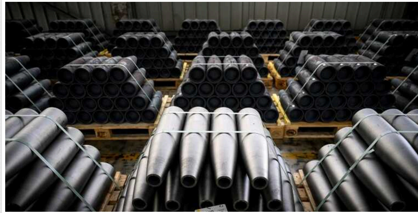
ЄС зможе виготовити 1,3 мільйона снарядів до кінця року, - Єврокомісар

Європейський Союз матиме можливість виробити щонайменше 1,3 мільйона снарядів до кінця 2024 року, адже перед ЄС стоїть подвійне завдання – надання військової допомоги Україні та поповнення власних запасів.