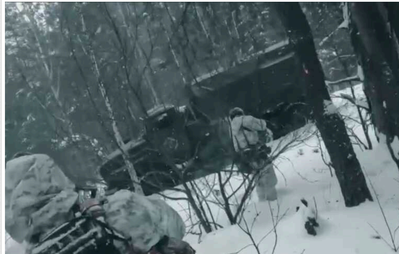
Бійці РДК опублікували відео нещодавнього рейду до Брянської області

У ході операції, як повідомляється, було знищено вантажілку з особовим складом прикордонних сил ФСБ РФ.