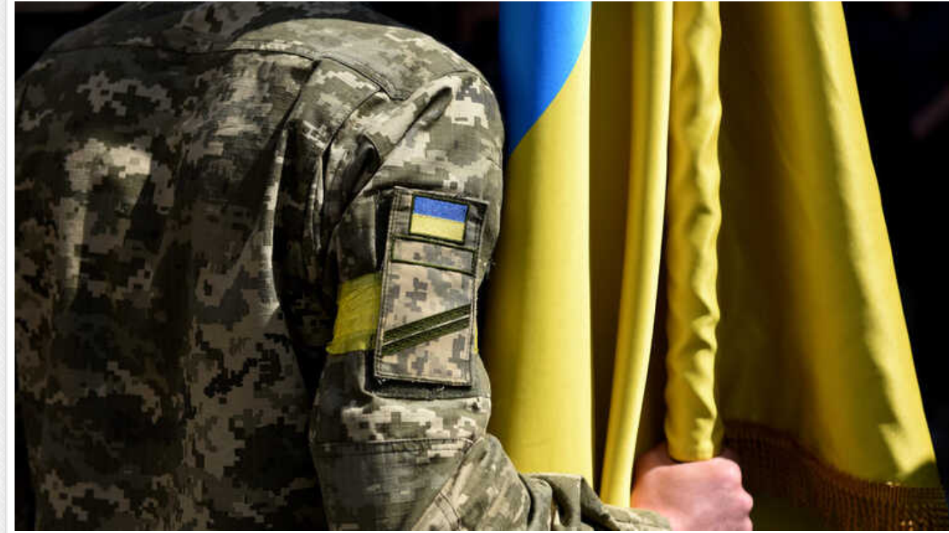
Чи мають бронь під час мобілізації вчені, і чи можуть їх забрати до армії

В Україні триває повномасштабна війна, яку розпочала країна-агресор Росія на території нашої держави. У зв'язку з цим, всі чоловіки віком від 18 до 60 років, вважаються військовозобов'язаними та підлягають мобілізації.