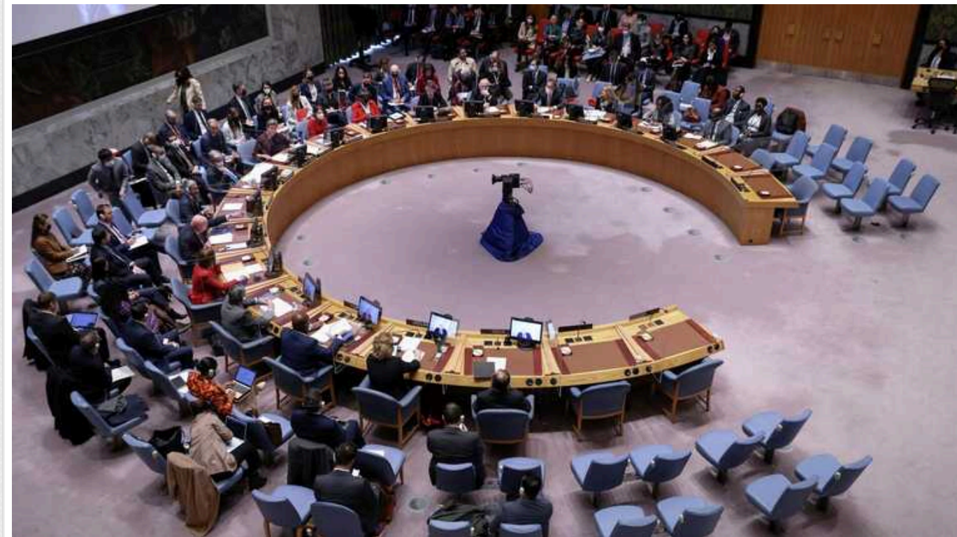
РФ вимагає обговорення допомоги Україні на засіданні Радбезу ООН

У понеділок, 22 січня, Рада Безпеки ООН на вимогу Росії проведе засідання з метою чергового «засудження» постачань зброї Україні для її протистояння російській агресії.