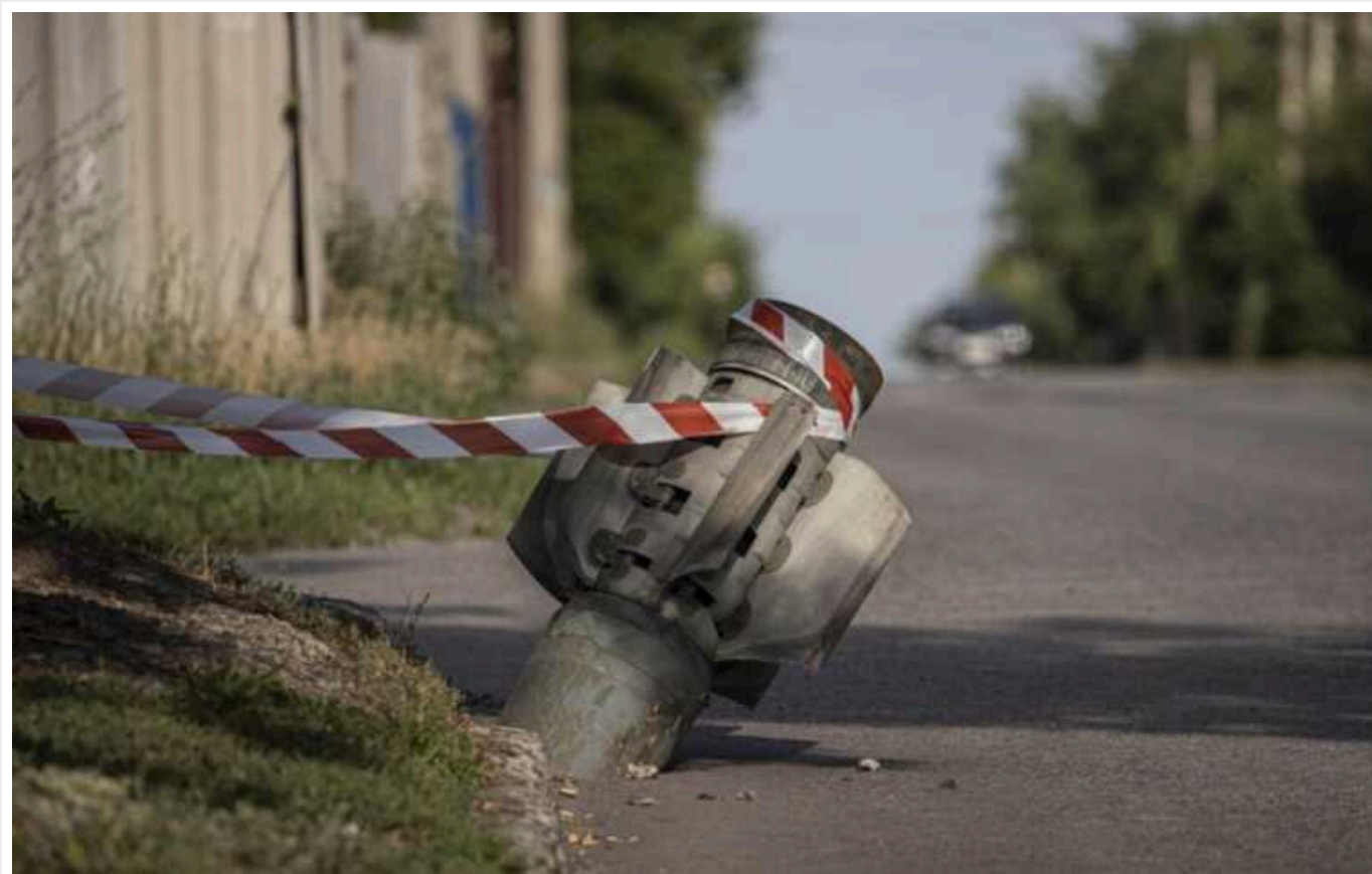
Окупанти за добу обстріляли Херсонську область майже 120 разів, є жертва і поранена дитина

Російська окупаційна армія за минулу добу, 19 січня, 119 разів обстріляла Херсонщину, внаслідок чого одна людина загинула. Окрім цього три особи - отримали поранення, серед них дитина.