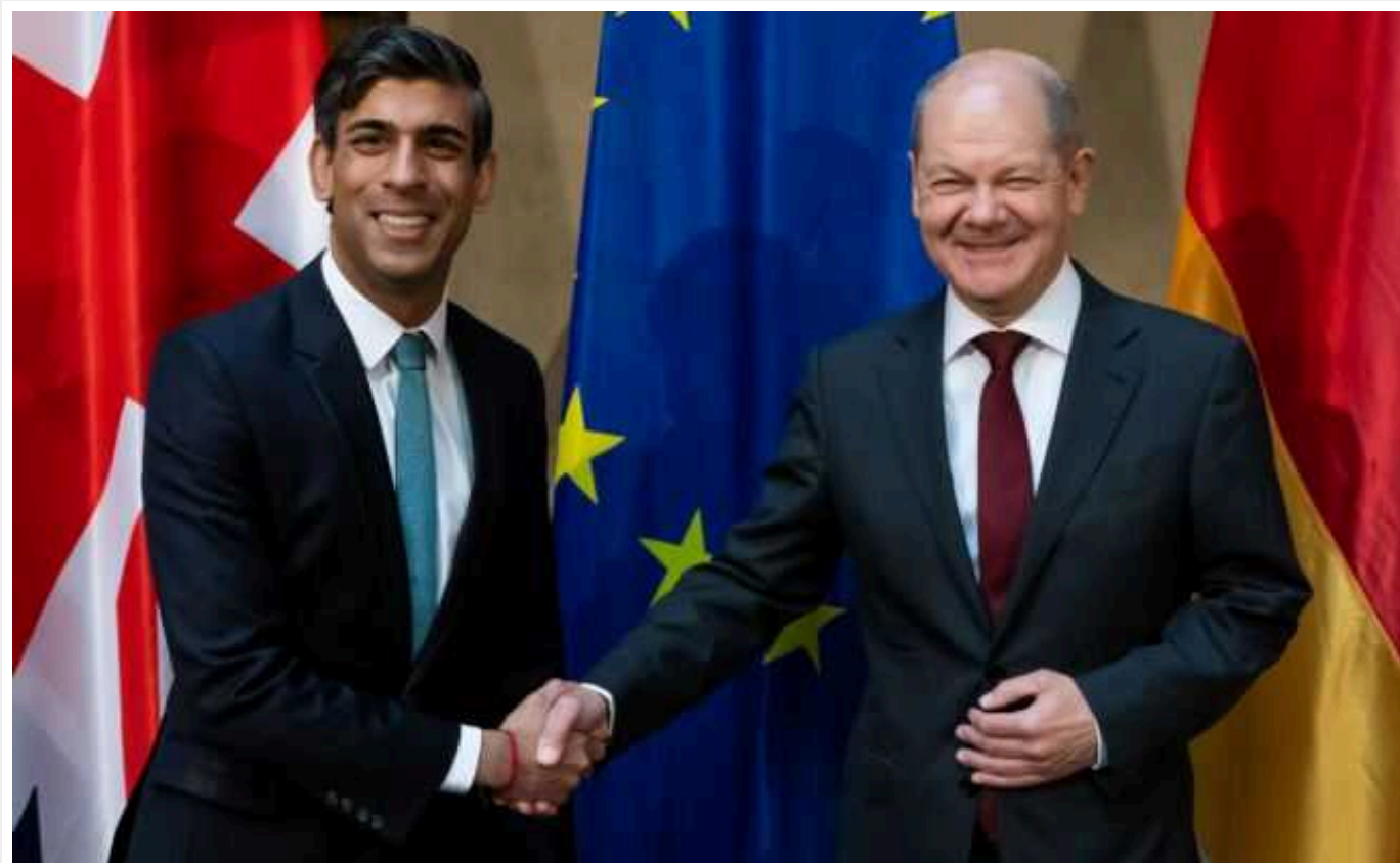
Шольц та Сунак обговорили продовження підтримки України

Прем'єр-міністр Великої Британії Ріші Сунак та канцлер Німеччини Олаф Шольц провели телефонну розмову, в якій обговорили подальшу допомогу Україні.