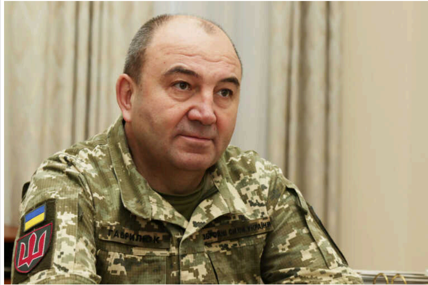
Одна з умов завершення війни - відмова РФ від ядерної зброї, - Міноборони

Війна між Україною та Росією повинна завершитись перемовинами та відмовою країни-терориста від ядерної зброї.