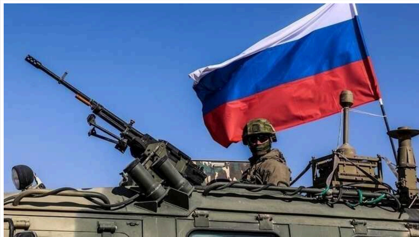
РФ хоче представити навчання НАТО як провокацію – ISW

На думку експертів Інституту вивчення війни (ISW), Росія намагається й надалі представляти в інформаційному просторі масштабні навчання НАТО Steadfast Defender 2024 як провокаційні.