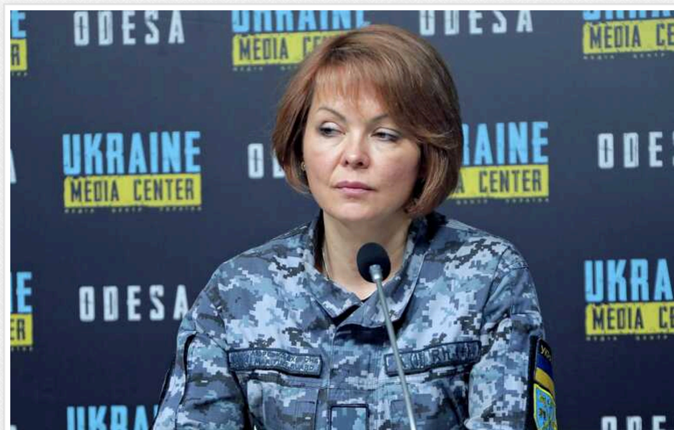
Війська протиповітряної оборони на півдні знищили два "Шахеда", - Гуменюк

Сили протиповітряної оборони на півдні вночі знищили два ворожі ударні безпілотники типу "Шахед".