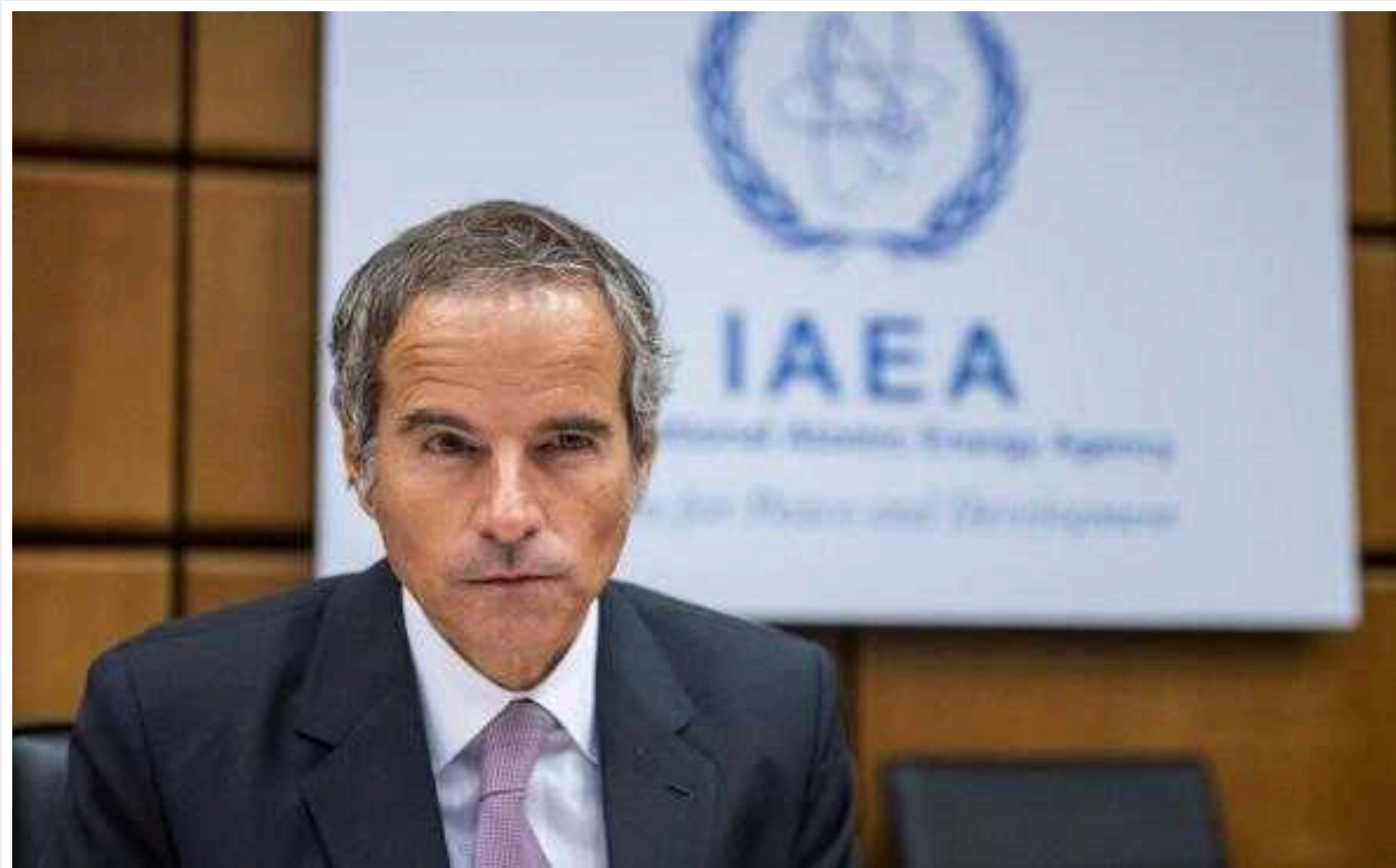
Окупанти знову замінували Запорізьку АЕС, - МАГАТЕ

Росіяни встановили міни на території Запорізької АЕС. Це порушує стандарти безпеки МАГАТЕ.