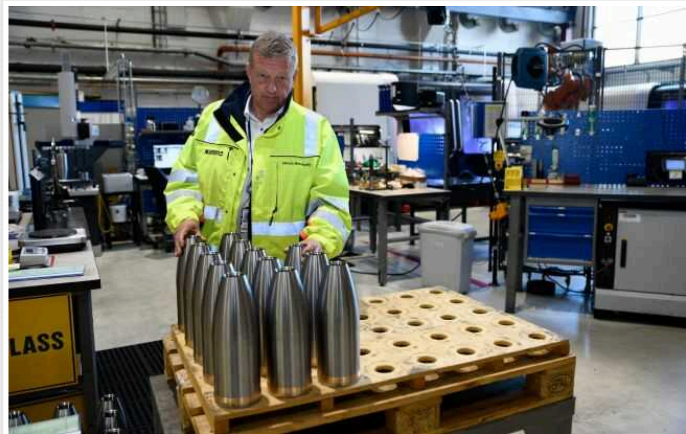
Фінляндія може призупинити виробництво боєприпасів для ЗСУ

У Фінляндії через страйки на два дні можуть зупинитися підприємства оборонної промисловості, які виробляють боєприпаси для України.