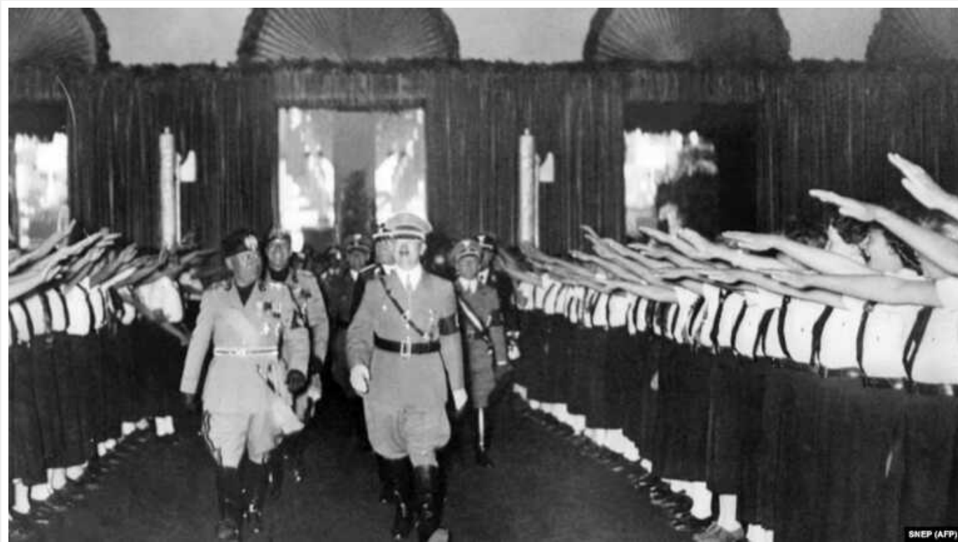
В Італії суд узаконив фашистське вітання "римський салют"

Високий суд в Італії ухвалив, що фашистське вітання не суперечить закону республіки, окрім тих випадків, коли загрожує громадському порядку або може бути пов'язане із відродженням забороненої в Італії фашистської партії.