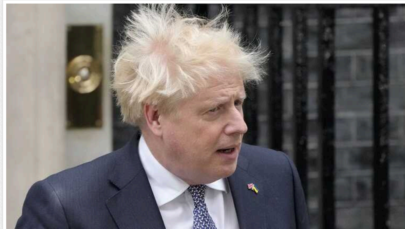
Борис Джонсон підтримав можливе повернення Трампа до влади в США: "Те, що потрібне світу саме зараз"

На тлі численних прогнозів на Заході, що повернення Дональда Трампа до влади в США призведе до катастрофи та припинення підтримки України, экс-президента Сполучених Штатів раптово підтримав колишній прем'єр-міністр Британії Борис Джонсон.