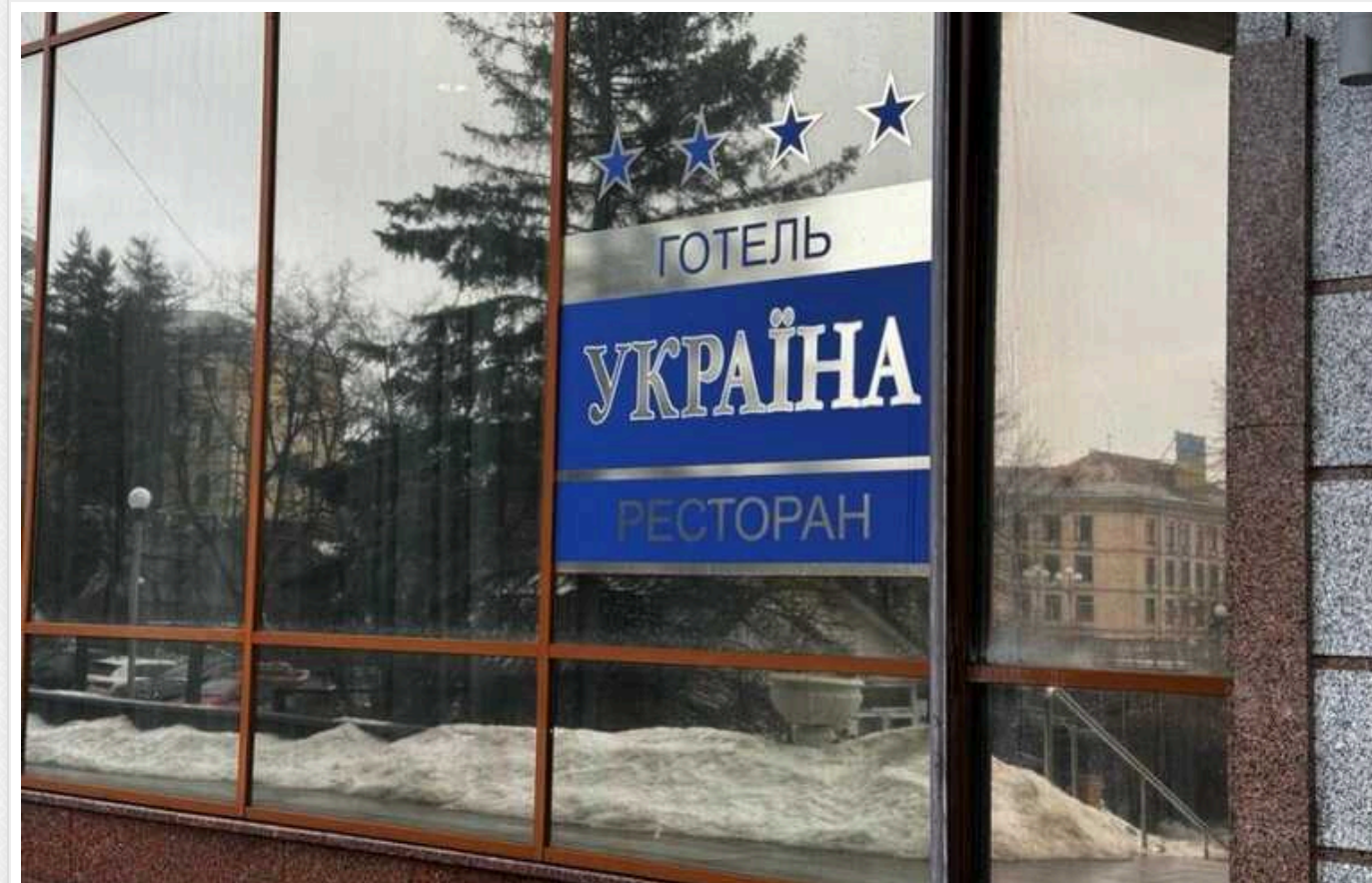
Фонд держмайна анонсував приватизацію готелю "Україна" у центрі Києва: накопичено боргів на 45 мільйонів

Про це повідомив голова ФДМ Віталій Коваль на своїй сторінці у Фейсбуці.