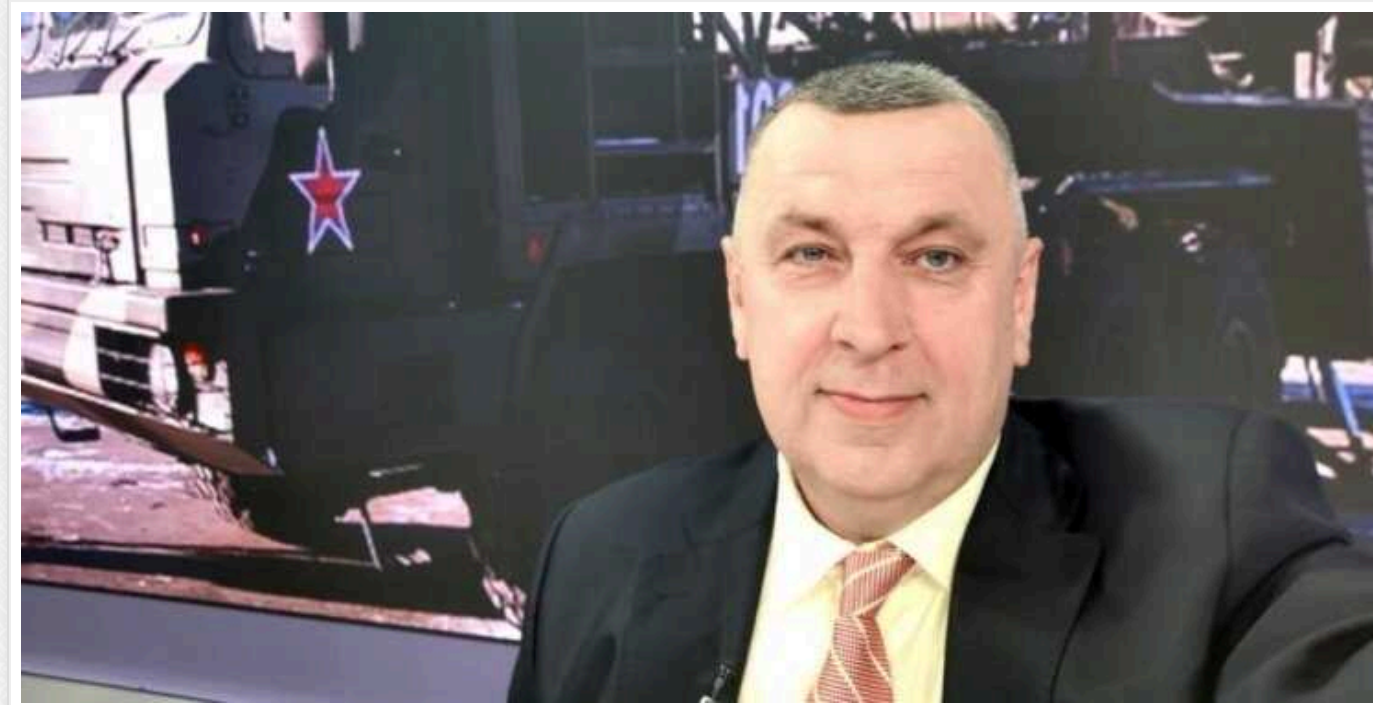
Поважаю й Арестовича: лідер організації Медведчука в Сербії відмовився її закрити, — ЗМІ