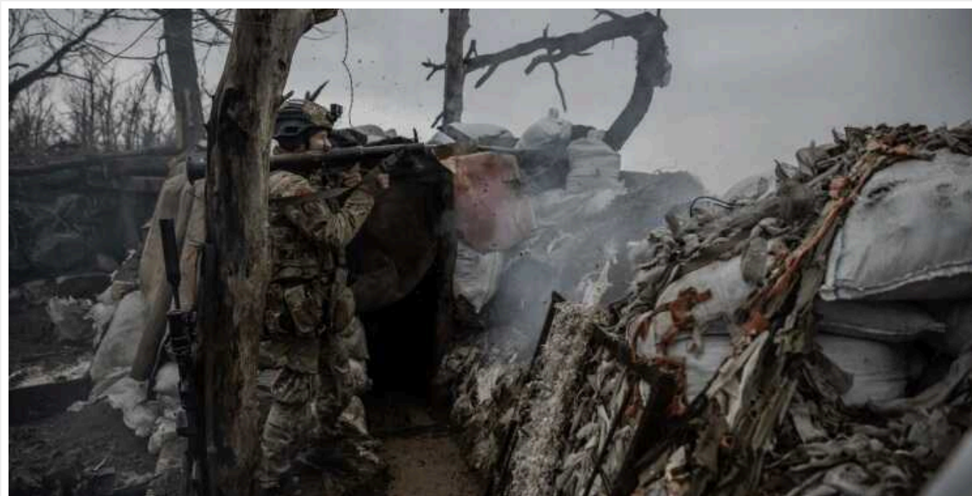
Поранений воїн ЗСУ без підтримки 46 днів був у тилу ворога та самостійно повернувся на позиції

Російські окупанти пішли у наступ і просунулися вперед, внаслідок чого військовий опинився в оточенні на початку листопада 2023 року.