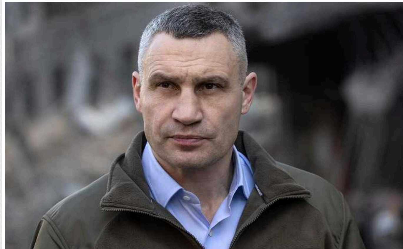
За охорону робочого офісу Кличка та його команди заплатять 21,9 мільйона гривень

Київрада уклала угоду зі столичною поліцією охорони, щоб вона забезпечила лад і спокій в будівлі, де знаходиться робочий кабінет київського мера – на Хрещатику, 36. Цю публічну закупівлю, хоч і був оголошений тендер, здійснили без відкритих торгів, а напругу з правоохоронцями.