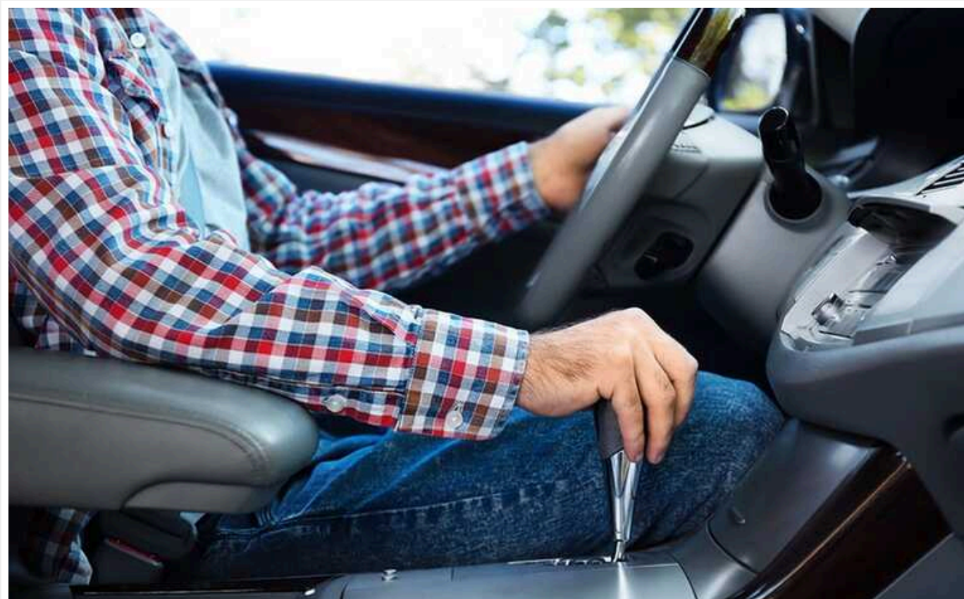
В Україні вживані автомобілі подорожчали на 9%

Зокрема, якщо на початку 2023 року середня ціна вживаного автомобіля, що продавався в Мережі, становила 4800 доларів, то наприкінці 2023 року – 6000 доларів. Зростання цін, як бачите, досить велике.