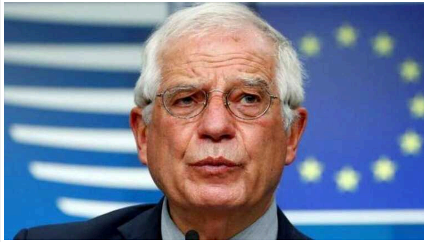
Боррель звинуватив Ізраїль у фінансуванні ХАМАС з метою послабити Палестинську автономію

Глава зовнішньополітичного відомства Європейського Союзу Жозеп Боррель заявив, що Ізраїль фінансував терористичне угруповання ХАМАС. Метою такого фінансування була спроба послабити Палестинську автономію.