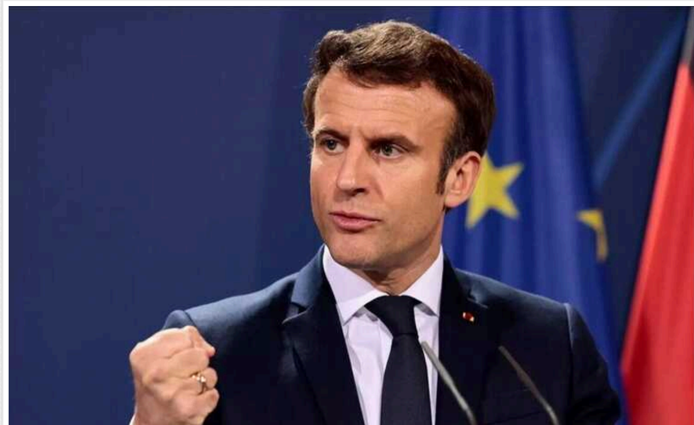
"Наш обов'язок - зробити перемогу Росії неможливою", - Макрон

Президент Франції Еммануель Макрон закликає Україну у подальшій підтримці в обороні від агресивної війни Росії.