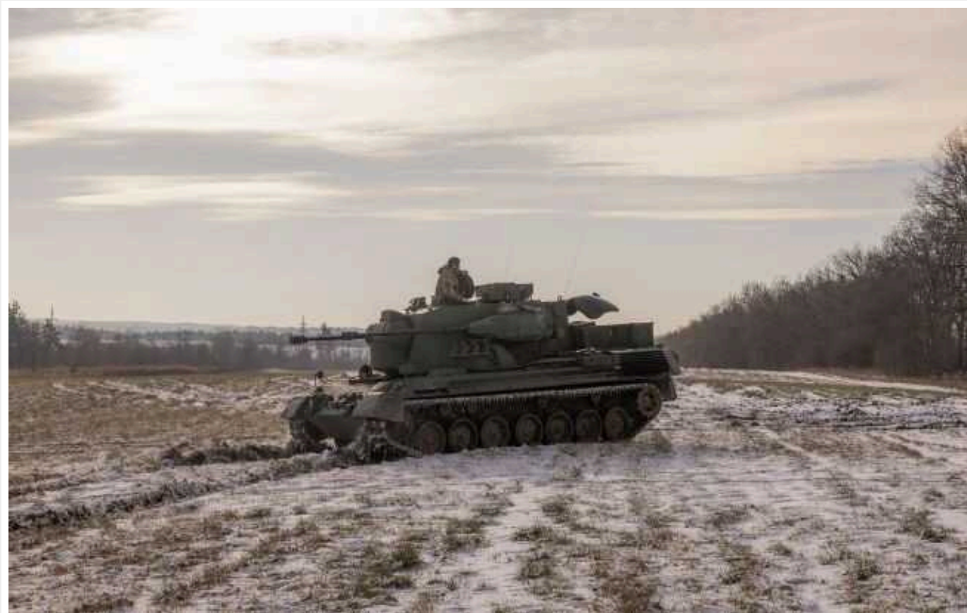
Ситуація на фронті: протягом доби сталося 87 бойових зіткнень

Українські воїни продовжують утримувати позиції на лівобережжі Дніпра, відбили атаки росіян поблизу Тернів (Донецька область) та вразили два артилерійські засоби противника.