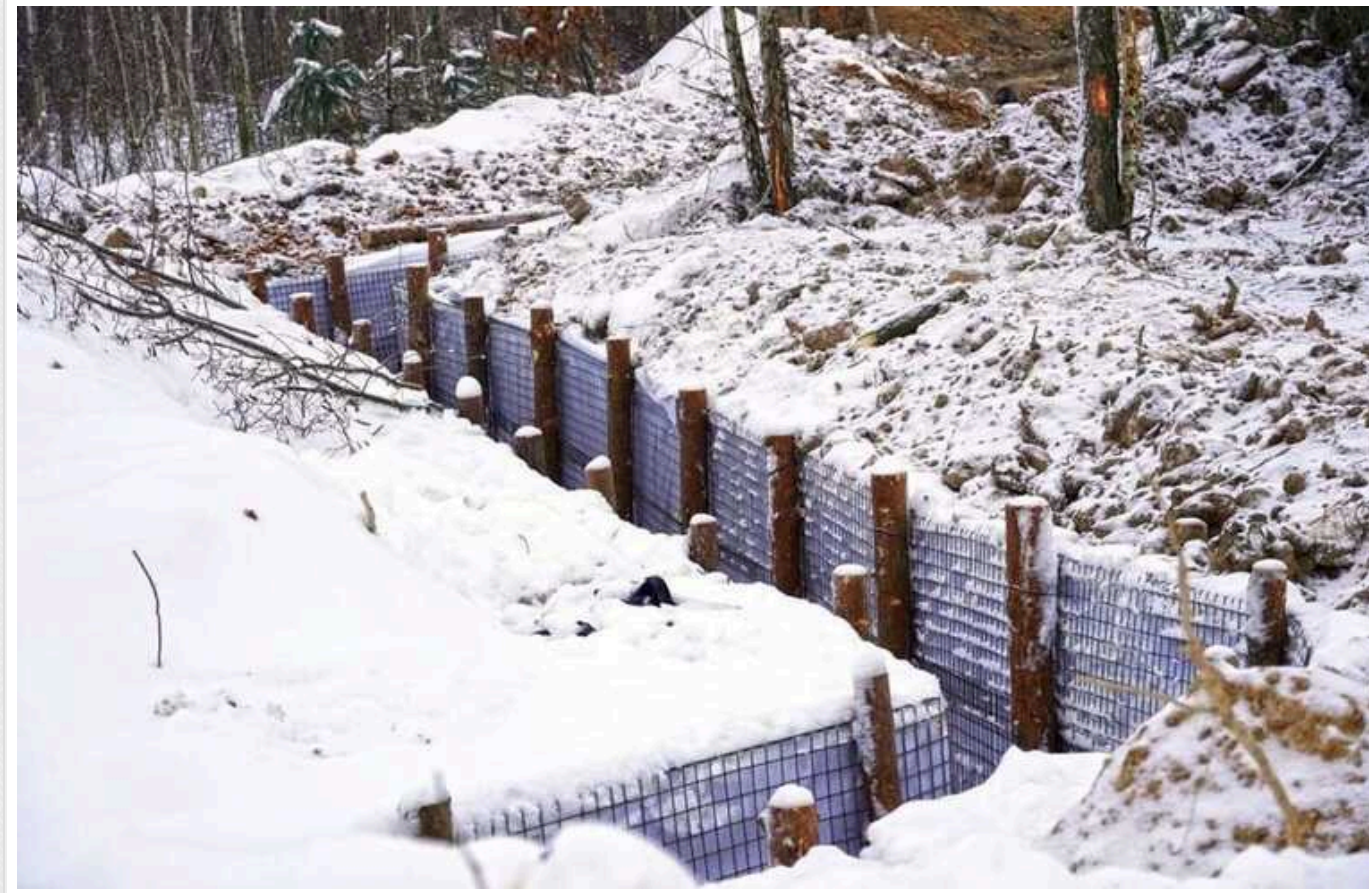
Кабмін виділив рекордні 17,5 мільярда гривень на зведення укріплень

Кабінет міністрів на засіданні у п'ятницю, 19 січня, виділяє 17,5 мільярда гривень на зведення фортифікаційних укріплень.