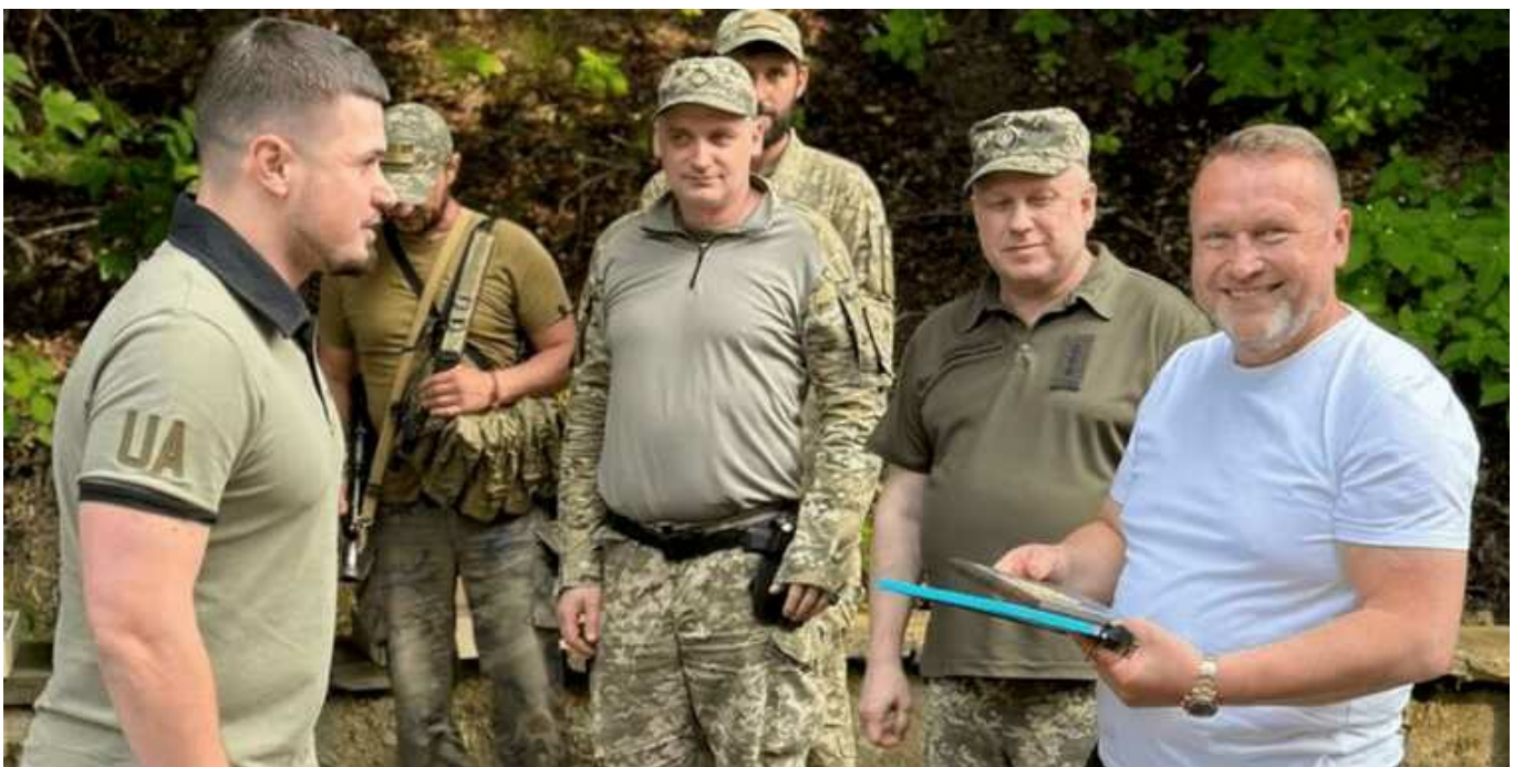
Суд Києва дозволив затримати п'ятого підозрюваного у справі Гринкевича

Печерський районний суд Києва сьогодні, 19 січня, надав дозвіл на затримання п'ятого підозрюваного у справі про постачання неякісного одягу для ЗСУ майже на один