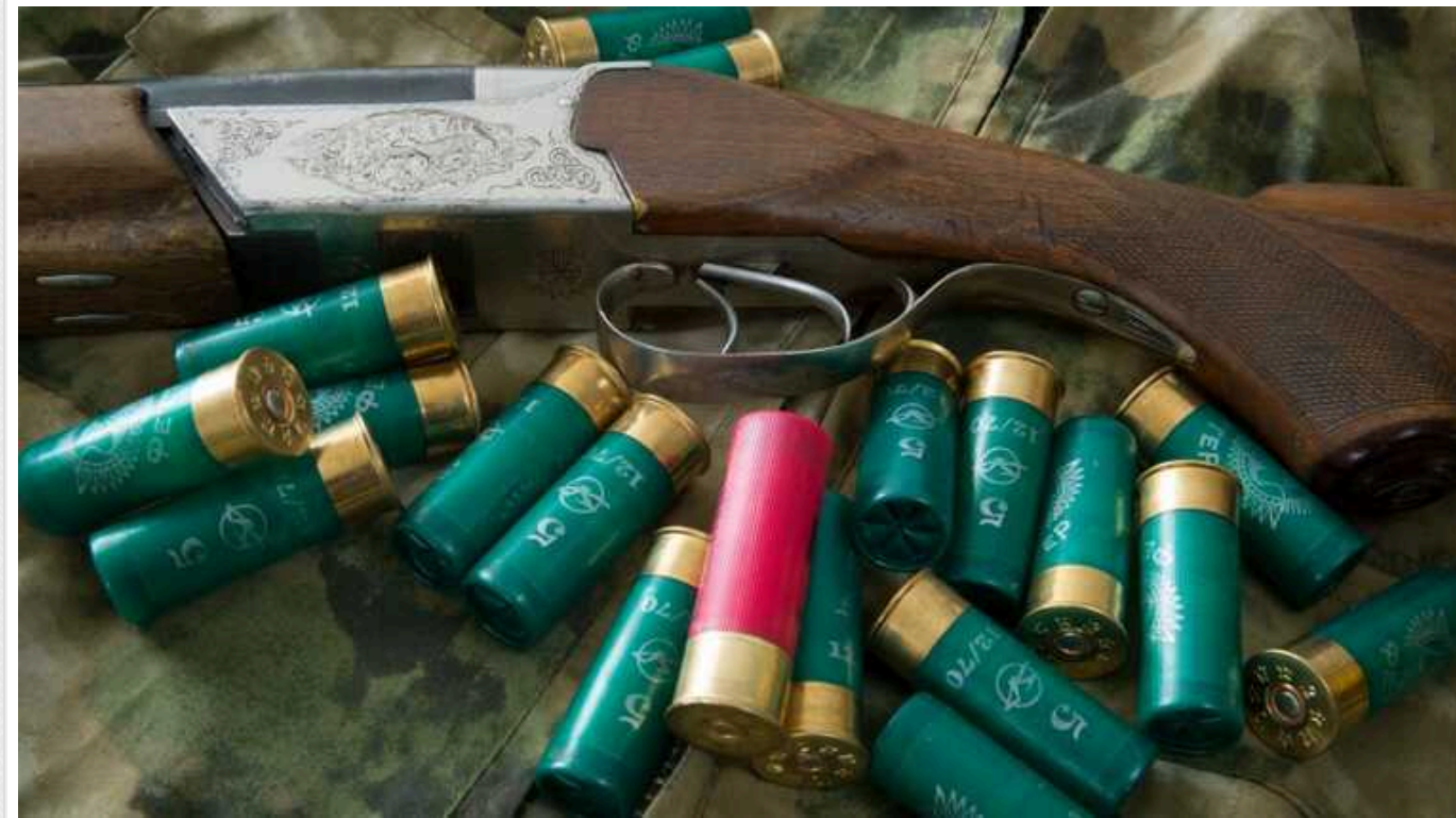
У Фінляндії хочуть запровадити ліцензії на експорт боєприпасів до РФ

В уряді Фінляндії розробили законодавчий проєкт, в якому готуються положення щодо необхідності отримання ліцензії на експорт боєприпасів до Росії.