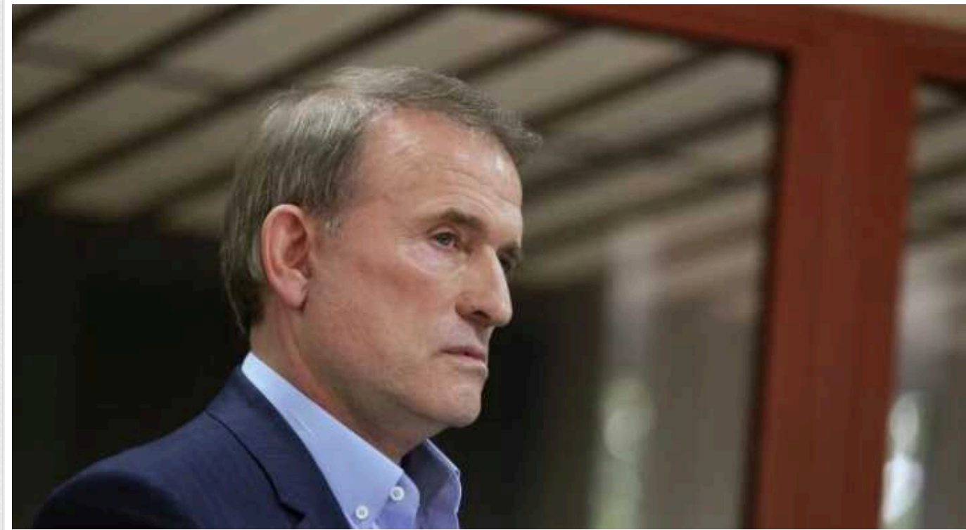
Україна просить Сербію заборонити діяльність організації, яку очолює Медведчук

Посольство України в Сербії надіслало офіційний протест до Міністерства закордонних справ країни. У ньому проситься припинити діяльність представництва громадської організації "Інша Україна" Віктора Медведчука.