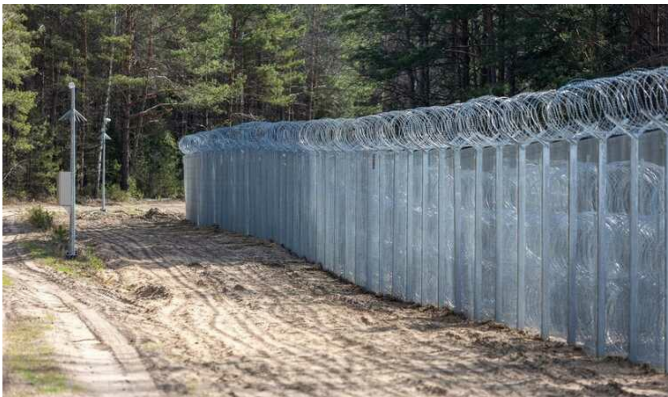
Країни Балтії домовилися збудувати «лінію оборони» на кордоні з РФ